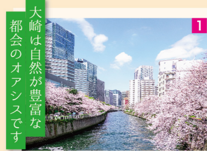
1 春 目黒川の桜 都会のオアシスです