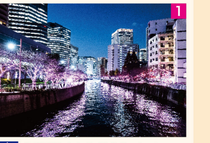
1 冬 「目黒川みんなのイルミネーション」