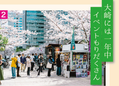
2 春 「目黒川の桜のライトアップ」に桜まつり