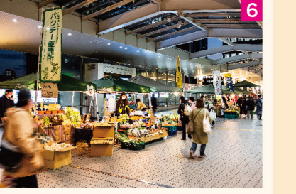
6 毎週行われる大崎マルシェ「二十四節気祭」

春は目黒川のライトアップや桜祭り。秋には品川区随一の規模のみんなで作り上げる地域イベント「しながわ夢さん橋」、冬は大崎の街を彩るイルミなど、大崎では年中楽しいイベントが行われています。