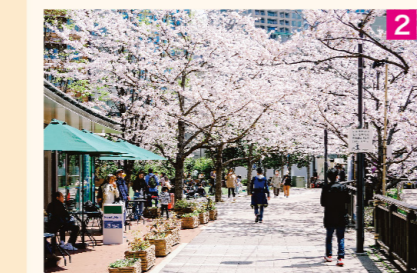
2 春 「五反田ふれあい水辺広場」の桜