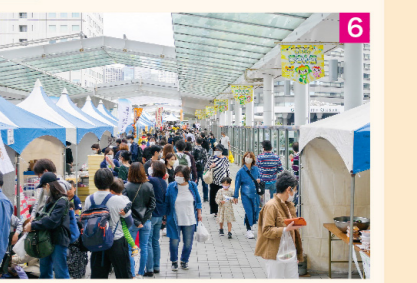
6 秋 3日間にわたり開催「しながわ夢さん橋」