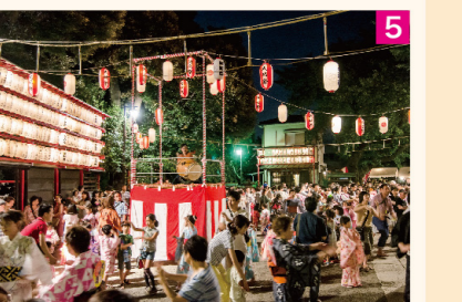
5 夏 “大崎の鎮守様”居木神社の「納涼祭」