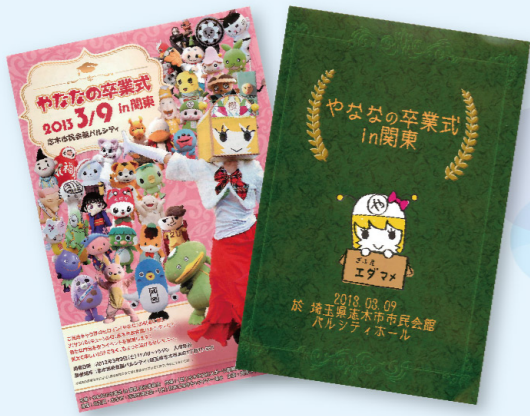
「やなな卒業式」のチラシとパンフレット。くもつるやふなっしー達と結成した関東キャラ連盟の主催だった。