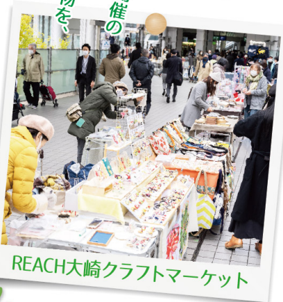
REACH大崎クラフトマーケット