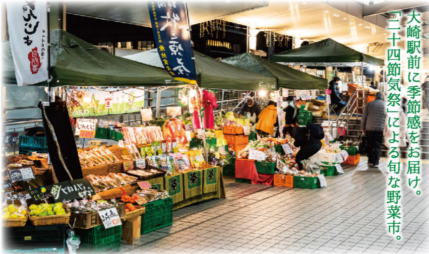
大崎駅前に季節感をお届け。『二十四節気祭』による旬な野菜市。

大崎駅前に季節感をお届け。駅前マルシェ「大崎二十四節気祭」による旬な野菜市。この春も、故郷の味と香りをどうぞ。