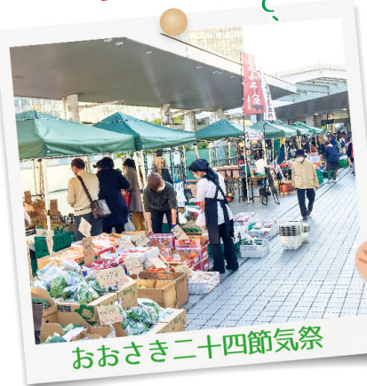
おおさき二十四節気祭