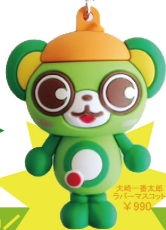
大崎一番太郎 ラバーマスコット ¥990