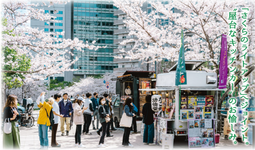
「さくらのライトアップ」へジョイント。『屋台なキッチンカー』のお楽しみ。

夜桜の目黒川畔にキッチンカーが集結。花よりグルメ派大歓迎のミニ屋台村が出現です。キッチンカーは日替わり出店、お好みの味覚に出会いましょう。