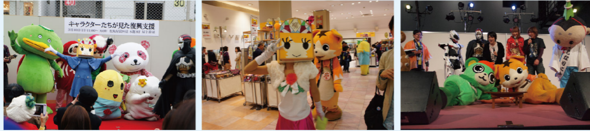
大丸松坂屋のさくらパンダと一緒に東日本大震災の復興イベントとセットで開催された。 | 犬山キャラクターたちが見た復興支援イベントとセットで開催された。 | 秋葉原で開催された「ご当地キャラ新年会」。オタク文化とのコラボが新鮮だった。