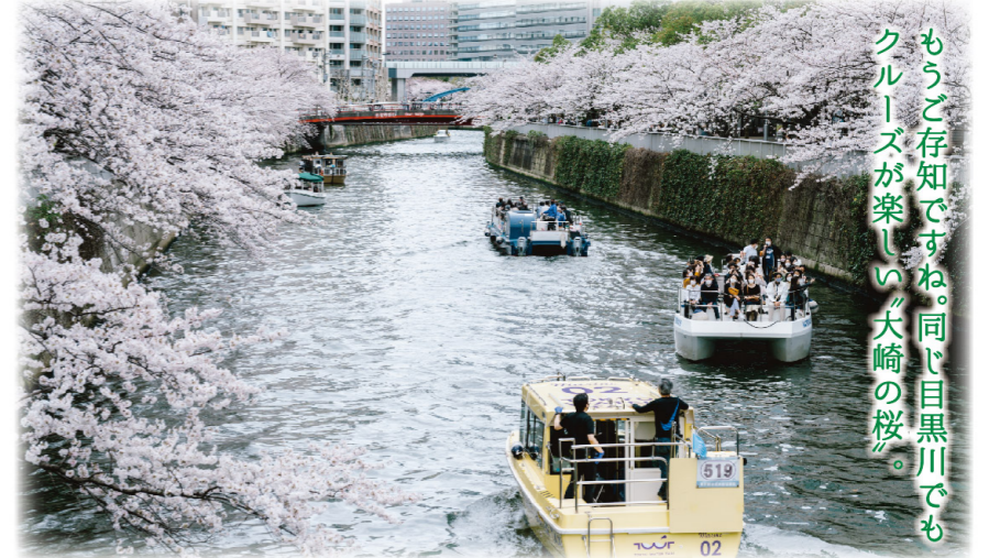
もうご存知ですね。同じ目黒川でもクルーズが楽しい『大崎の桜』。

ロングショットで両岸を覆い尽くす桜並木を眺める醍醐味は格別。大崎で桜そのものの美しさを愛でましょう。クルーズなら目黒川の舟運事業の拠点「五反田リバーステーション」からどうぞ。