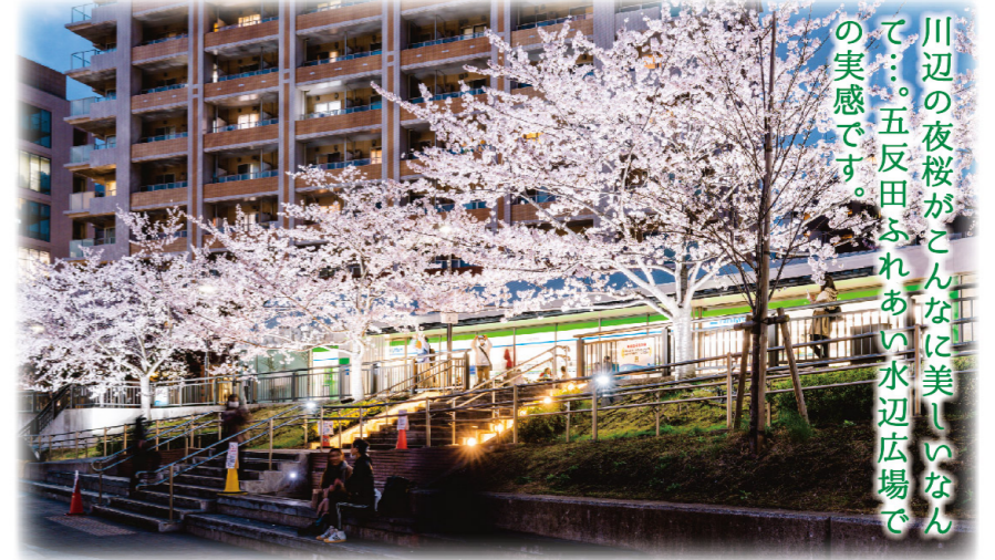
川辺の夜桜がこんなに美しいなんて。五反田ふれあい水辺広場での実感です。

昼間でも十分美しい目黒川の桜が、夜のライトアップでいっそう華やかに。今や大崎・五反田地区の名物となった夜桜鑑賞。魅惑的な春の夕べにぜひ。(みんなの屋台村)もお楽しみに！