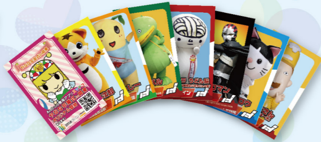
当時まだ珍しかったクラウドファンディングで資金調達した際、返礼品として送られた出演キャラのカード。ふなっしーをはじめ数々のキャラがカードに!