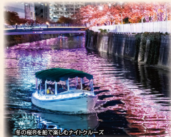
冬の桜®を船で楽しむナイトクルーズ