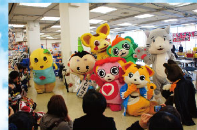
ブレイク前のふなっしーをはじめ、『英雄伝説 軌跡』シリーズのキャラ、みっしーも参加。

「ゆるキャラ論」や各キャラのグッズも販売。出版社の担当編集も手伝いに来てくれた記憶が…。