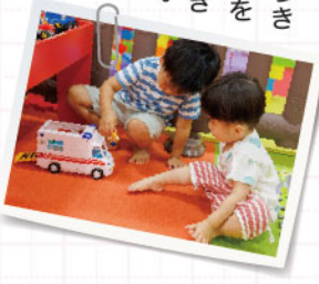
子育てに「困った!」はつきもの。便利なサービスを知っておけば、そんなときに絶望せずに済みます。ぜひ必要な時に利用できるようにしておいてください。

◆「子どもショートステイ(宿泊を伴う一時預かり)」 保護者の入院、出張、冠婚葬祭、育児疲れなどで、一時的に養育が困難になった時に、最大で7日まで連続して預かってもらえます(要事前登録)。