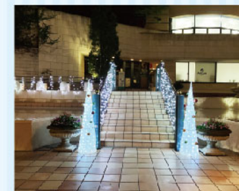
【サンクンガーデン】