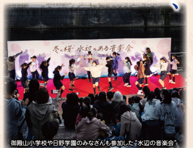
御殿山小学校や日野学園のみなさんも参加した「水辺の音楽会」