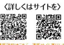
【詳しくはサイトを】 通販詳細はこちら 通販サイト直リンク