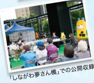
「しながわ夢さん橋」での公開収録