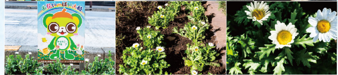
この12月も、元気な力が結集！2,000鉢ものノースポールが植えられました。

まちを美しくと願って続けられ、もはや大崎の伝統行事となった“花植え活動”。再開発で生まれ変わった高層ビルのまちに、それは、人の息吹とぬくもりに満ちた“郷土OSAKI”への思いを、皆でつなげていく事なのかもしれません。そして今、そんな大崎に、振り返って見れば古式ゆかしき神社の習わしが。——花と神社と「ひと」が紡ぐ、“オリジナルなOSAKI”をご紹介します！