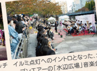
イルミネーションへのイントロとなった、オープンエアーの「水辺広場」音楽会上げで...