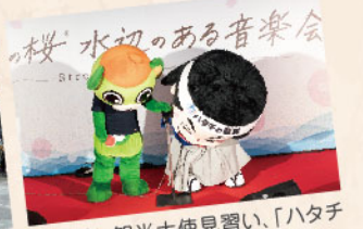
しながわ観光大使見習い、「ハタチの龍馬」と「大崎一番太郎」も盛り上げて...