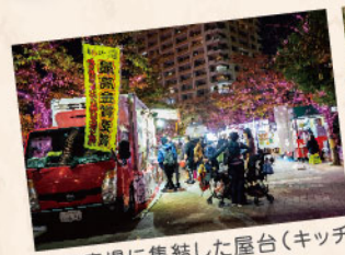
水辺広場に集結した屋台(キッチンカー)で暖まるひと時