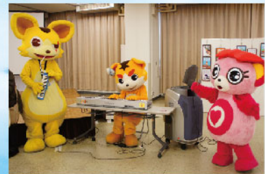
スパンキーと銀次郎が所属しているご当地キャラバンド「GCB47」よりも早く、楽器演奏が実現!