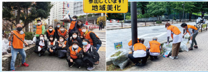
参加しています！ 地域美化 日々のお手入れ「セガサミーグループ」の皆さん を実施される