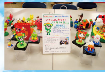
後にテレビのバラエティ番組で大ブレイクし、売れっ子となった、ねんど作家のおちゃび先生の実演も。