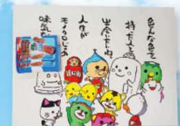
◀イラストに名言を添えたスタイルで、今も根強い人気のお笑い芸人・ヤボンスキーこばやし画伯もゲストに来てくれた。