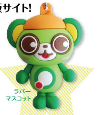
ラバーマスコット

全約70種! 一見よ、この執念のモノ(グッズ)づくり。ワ、君へ、大崎人は只者(フツ)じゃないぞって教えよう!