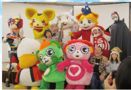
◀今や大人気のふなっしーも参加。この頃は誰からも見向きもされず、ふつうにみんなと遊んでいた。