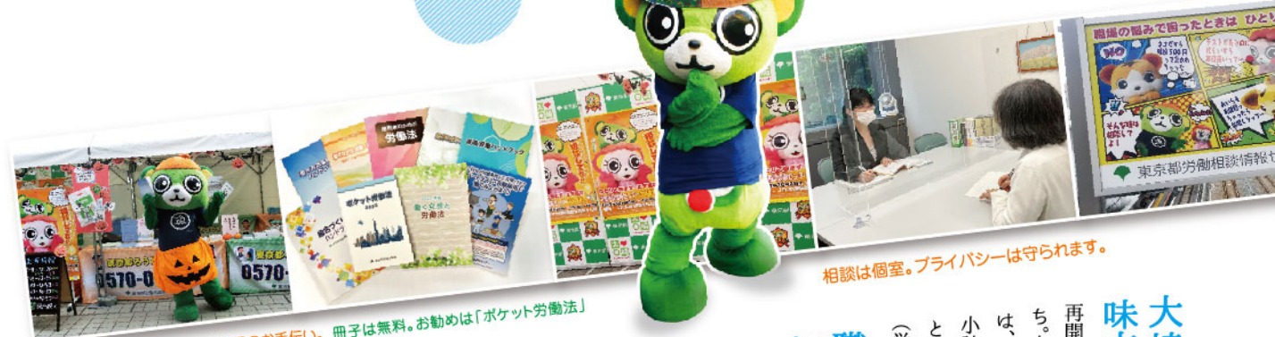
相談は個室。プライバシーは守られます。

東京都労働相談情報センター大崎事務所 / 〒141-0032 東京都品川区大崎1-11-1 ゲートシティ大崎ウエストタワー2階 TEL 03-3495-4872(代表) TEL 03-3495-6110(労働相談)