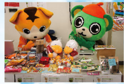
「ゆるキャラ論」やご当地キャラグッズの販売も。当時、関東ではグッズの買えるイベントは少なかった。