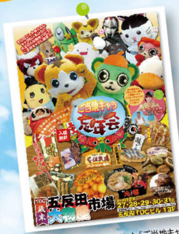
2013年末にTOCで開催された「ご当地キャラ忘年会」。今では実現不可能な豪華メンバー。