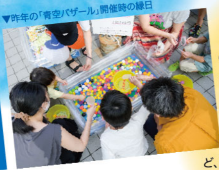
▲昨年の「青空バザール」開催時の縁日

みんなを喜ばせるために、常に新しいコト、懐かしいコトにチャレンジし続ける、金春湯オーナーの角屋さん