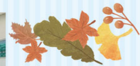
【ウエスト棟3Fエントランス】