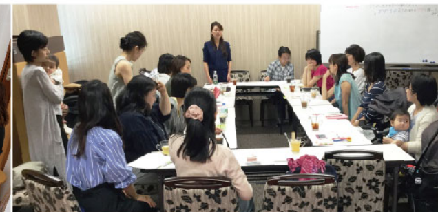
企業の集客活動支援にもつながる「わたがしひろば」。「ママの働き方座談会」で