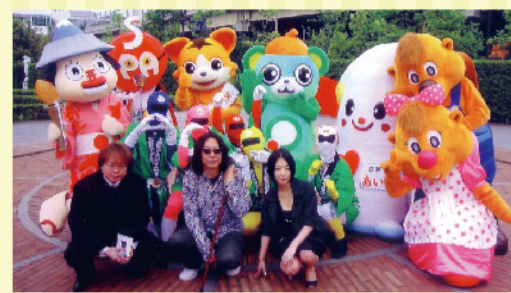
2007年に放映された「シンボルズ」のゆるキャラ特集。一番太郎は「可愛すぎるから、ゆるキャラじゃない」と判定された。