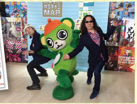
2007年に放送された「ゆるキャラに負けない」で、みうらじゅん氏と再会。しかし一番太郎も筆者もまったく覚えられておらず、初対面の挨拶を交わした。