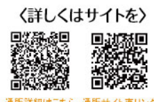
通販詳細はこちら 通販サイト直リンク