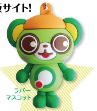
ラバーマスコット

全約70種！一見よ、この執念のモノ(グッズ)づくり。ワ、君へ、大崎人は只者(フツ)じゃないぞって教えよう！