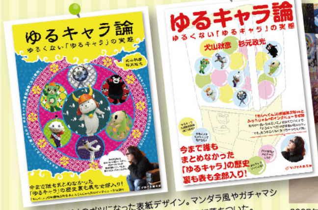
「ゆるキャラ論」のポツになった表紙デザイン。マンダラ風やガチャマン風など迷走した末、結局シンプルな現在のものに落ち着いた。