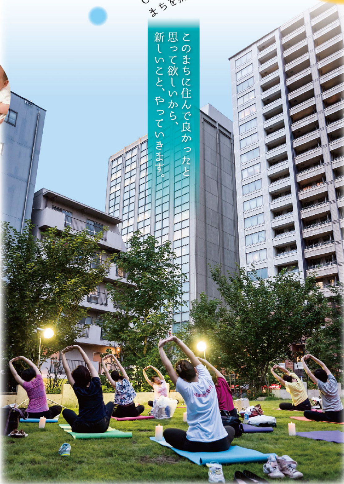
「ママかつ」時代の2017年夏。注目を集めた五反田ふれあい水辺広場での「ナイトヨガ」イベント