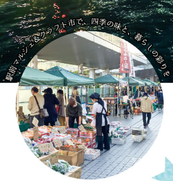
駅前マルシェとクラフト市で、四季の味と、暮らしの彩りを

大崎のまちいっぱい、いつもの桜が花開いて、元気な季節の 再来です。戻りつつある人々の笑顔や賑わいも、このまちには ぴったり。春から初夏への移ろいの中で、桜のライトアップを はじめとして“まちに花を”の活動や、新鮮な四季の野菜の直 行便(マルシェ)、さらにクラフト市や、5月の空に泳ぐ鯉のぼ りなど、見渡せば美しいいっぱいの大崎へ、ようこそ!です。