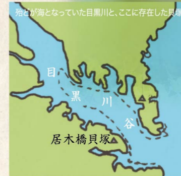
殆どが海となっていた目黒川と、ここに存在した貝塚