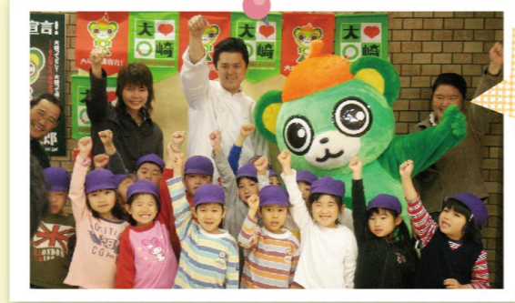
▲地元の子供たちといっしょに、ケーブルテレビ品川に出演。なんとなくまだ初々しさの残る一番太郎と若き日の商店会長