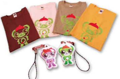
▲デビュー当時に作られたグッズ。しかしその後、作られるグッズの数は減ってゆく…

そんなトラブルもありつつ、なんとか無事に華々しいデビューを飾ったかに思えた一番太郎ですがその時の写真は一枚もありません。会場の撮影を担当していた