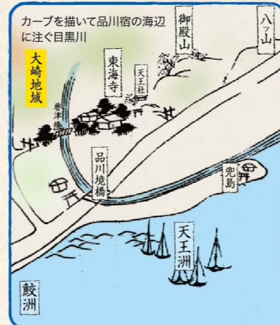
東海道の第一宿として賑わいを見せた品川宿の海辺に注ぐ目黒川。当時の目黒川はカーブを描いてハツ山方面へと流れ込んでいました。大崎地域は海がすぐそばに迫る川口にあり、やがて水利の良さから目黒川河畔には海運を通じて近代産業の礎が築かれていくこととなります。