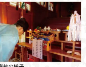
栃木県足利織姫神社