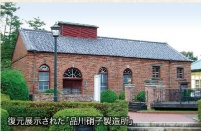
復元展示された「品川硝子製造所」

明治の時代となって、大崎は大きな変革の歴史を迎えることとなります。日露戦争の頃には、目黒川沿岸に相次いで工場が建てられ、農業中心だった大崎の産業も、明治政府の殖産興業政策の下で目覚ましい工業化への変貌を遂げていきます。中でも、明治初頭に造られた日本初の近代ガラス工場「品川硝子製作所」は、代表的なものづくりの種子となり、その後の大崎の工業化へ、さらには技術立国日本の牽引役としての役割を果たしていったのでした。(続く)