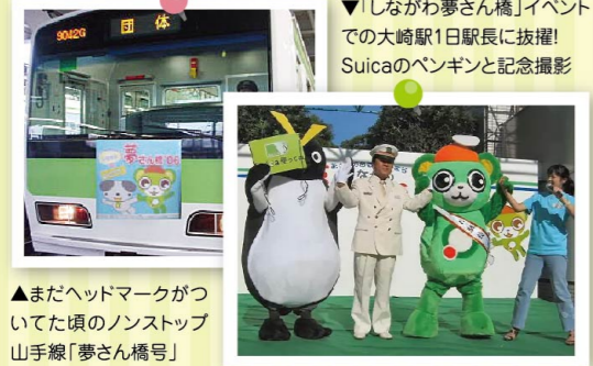
▼「しながわ夢さん橋」イベントでの大崎駅1日駅長に抜擢！Suicaのペンギンと記念撮影