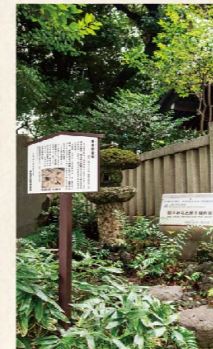
居木神社脇の立て札が示す『居木橋遺跡』。周辺では5つの貝塚が確認され、また竪穴式住居跡からはクジラの骨製の骨器や中仕切のある高台付鉢、さらに深鉢土器や耳飾りなども出土し、縄文時代前期の貴重な遺跡として大きな注目を集めました。(写真右・下)