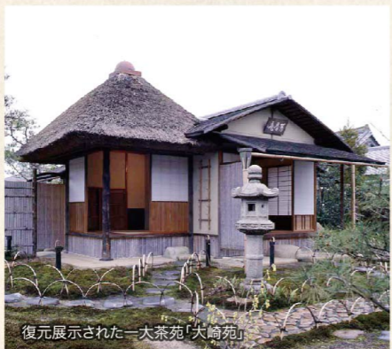
復元展示された一大茶苑「大崎苑」