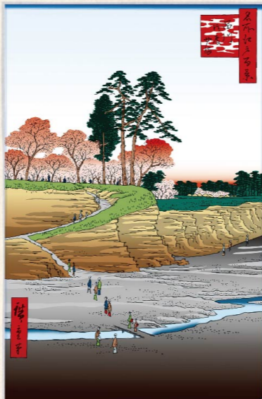
桜咲く「江戸の絶景リゾート地」として多くの浮世絵に描かれ、人気を集めた御殿山～大崎周辺。