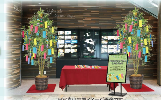
※写真は設置イメージ画像です

◆「ThinkPark」ホームページ http://www.thinkpark.jp/