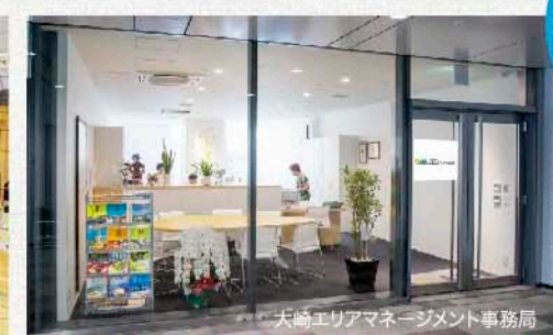
大崎エリアマネジメント事務局

「まち運営活動」の推進母体として、地域の維持 発展に向けた幅広い取り組みを行っています。 (一社)大崎エリアマネジメントは、先に挙げた「イベ ント支援」に加え、「大崎駅周辺まち運営プランの策定」 「景観形成、ユニバーサルデザイン、環境配慮等ガイド ライン策定」「地域防災の勉強会」「災害時における情報 収集、発信、連絡体制の確立」等を行い、大崎のいっ そうの魅力づくりと付加価値の向上を目指しています。