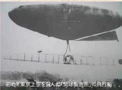
初めて東京上空を飛んだ「気球製造所」の飛行船