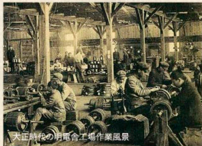
大正時代の明電舎工場作業風景