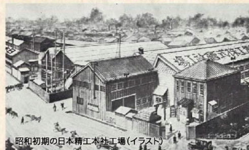
昭和初期の日本精工本社工場(イラスト)