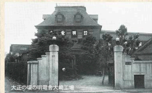
大正の頃の明電舎大崎工場