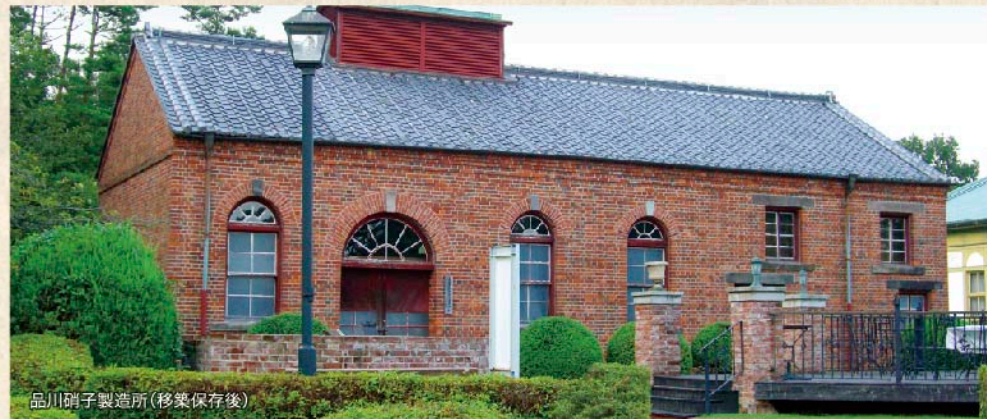
品川硝子製造所(移築保存後)