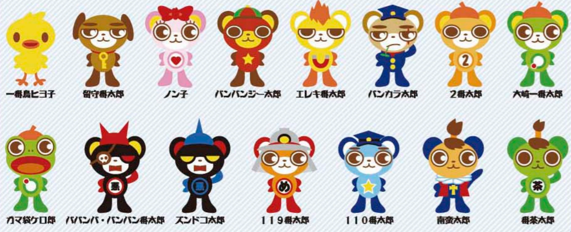
一雫鳥ヒヨ子 留守番太郎 ノ子 パンパンジー太郎 エレキ番太郎 パンカラ太郎 2番太郎 大崎一番太郎 ガマ袋ケロロ パンパ・パンパン番太郎 スンドコ太郎 119番太郎 110番太郎 南蛮太郎 番茶太郎