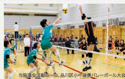
当協議会活動の一つ、品川区小中連携バレーボール大会

「大崎ウェルカム・ビジョン」や 「ギャラリーボード」の運用&広報誌 の発行を行っています。