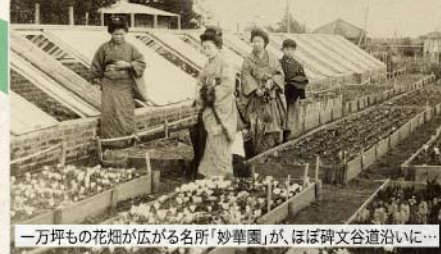
一万坪もの花畑が広がる名所「妙華園」が、ほぼ碑文谷道沿いに...

大崎の中心部を開いてほぼ平行に伸びる「幾つかの碑文谷道」 江戸の昔より、多くの寺社参拝者を集める人気ルートとして発達した目黒道や碑文谷道。これらは出発地ごとに、また新たな支道の開発などによって多岐にわたるルートが存在し、その位置についても、都市化が進む中で道跡も失われ、往時の道標を辿ることで「推定する」というのが実情です。その中でも、大崎の中心エリアを取り囲むように西に伸びる複数の碑文谷道については、その沿道に幾つかの歴史の経緯をしのぶ貴重な足跡を残して、古道を訪ねる人々の関心を集めています。