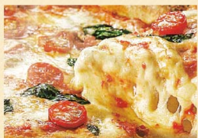
直輸入の有機エクストラバージンオリーブオイルを使用。香り高く焼き上げた自家製の石窯焼きピッツア (予約は来店またはお電話で)

お召しあがれ。生地や材料にこだわり、店内の石窯で焼き上げることで、本格的なピッツアの美味しさをお楽しみいただけます」とのことです。