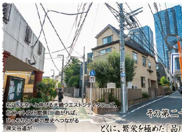
右は、天空へと伸びる大崎ウエストシティタワーズ。 左(トット文化館側)へ曲がれば、ひっそりと大崎の歴史へつながる碑文谷道が...

とくに、繁栄を極めた「品川宿」から、往時の人々の参詣と物見遊山へのルートを広げた「碑文谷道」。私たちの暮らしのすぐ足元にあったその古道を辿り、「道沿いの歴史」を眺めます。