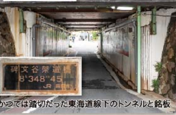
「碑文谷道」を証すガード

「左ひ文や道」「右めぐろ道」(※表通り)へ... 東海道、南番場からの道が2つに分かれる場所に立つ江戸時代の道標より