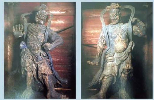
「法華寺」から「円融寺」に変遷後、一大信仰ブームを呼んだ「円融寺の黒仁王尊」