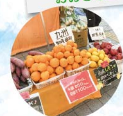
“季節のお届け人”が 元気な掛け声で並べる 旬野菜の数々...