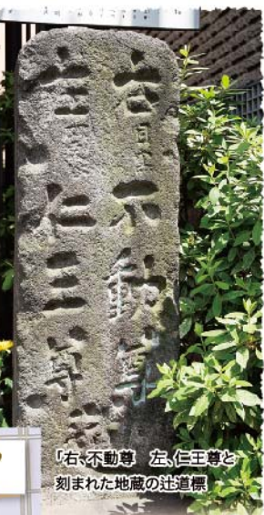
「右」不動尊 左、仁王尊と刻まれた地蔵の辻道標