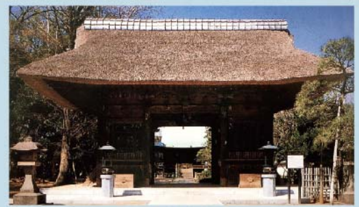
碑文谷道のゴールとして賑わった天台宗「円融寺」(※江戸中期以前は日蓮宗「法華寺」)