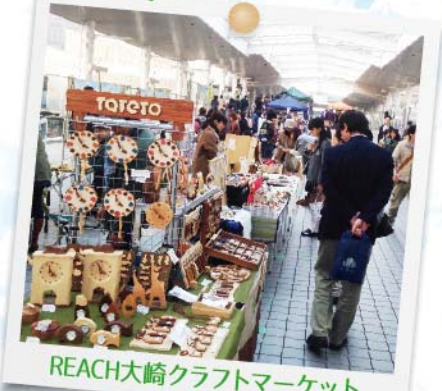
REACH大崎クラフトマーケット