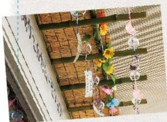
駅前マルシェの「おおさき二十四節気祭」や「REACH大崎クラフトマーケット」も…