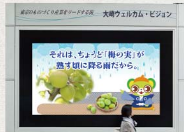
四季の移ろいに沿って、毎月、それぞれの季節感と季節解説を映像でお届けする「大崎ウエルカム・ビジョン」の季節メッセージ

（一社）大崎エリアマネジメント（OAM）では、これまで、大崎を訪れる多くの人々やここに暮らす方々へのおもてなしの一環として、日本の季節感をテーマとした駅前ディスプレイや映像メッセージの提供に力を注いできました。