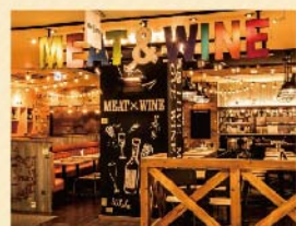
丁寧な仕込みと豪快な焼き上げで評判の肉料理