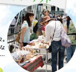
掘り出し物の、イイモノ色々。 思いがけないシアワセな 発見もありそう...