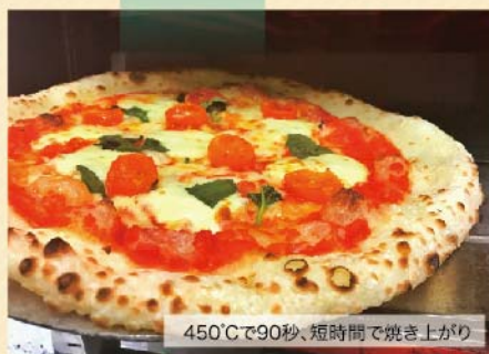
450°Cで90秒、短時間で焼き上がり