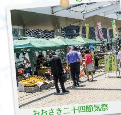
おおさき二十四節気祭