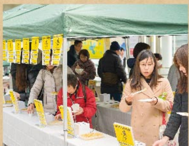
会場はSNS等を通じて集まった若いグループでいっぱい