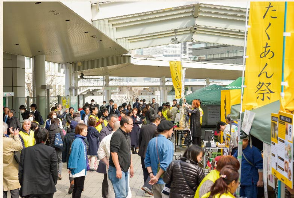
2/22、23の2日間にわたり大崎駅前で行われた「ビルの谷間のたくあん祭「お新香の逆襲」」イベントでは、全国のたくあん販売をはじめ「夢たくあんグランプリ2019」も開催。「たくあん」のキーワードの持つユニークさや新鮮さも手伝って、大勢の人々が詰めかけています。

去る2月22・23日、大崎駅南改札口前デッキ(夢さん橋)で行われた「ビルの谷間のたくあん祭「お新香の逆襲」(沢庵和尚夢見の会他2者主催)には、大勢の通行客やオフィスワーカーが集まり、珍しい「たくあん漬け」絡みのイベントとして注目を集めました。たくあんを盛り上げるイベント」と銘打って行われたこの催し、沢庵和尚が晩年を過ごした名刹「東海寺」にほど近い大崎ならではの地縁イベントとして誕生。ここから今、沢庵和尚が伝えた「たくあん漬け」の新しい価値と深い味わいの「逆襲」が始まっています。