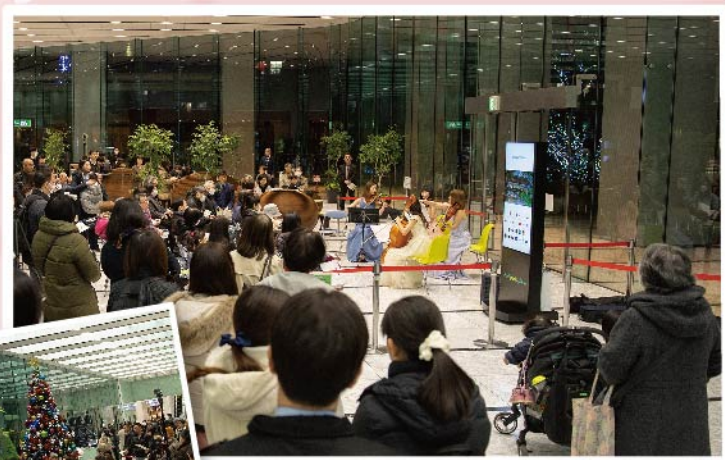
Christmas(左)、NewYear(上)と、四季折々に美しい調べを伴って、大崎に季節の訪れを告げてきたコンサート。この春も、ThinkPark Towerに「スプリングコンサート」がやってきます。