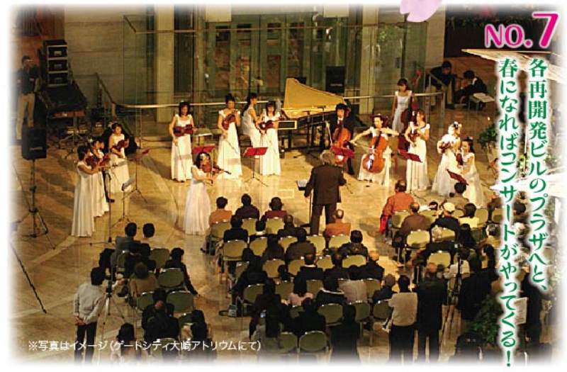
NO.7 各再開発ビルのプラザへと、春になればコンサートがやってくる！