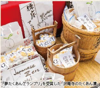
「夢たくあんグランプリ」を受賞した「沢庵寺のたくあん漬」