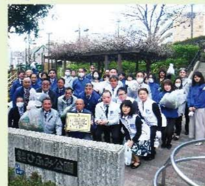
■表彰状を囲む地元ボランティア陣(西口ひふみ公園にて)

「お花いっぱい大崎」運動へ、高い評価!—— 品川区環境保全活動顕彰地域賞を受賞しました。