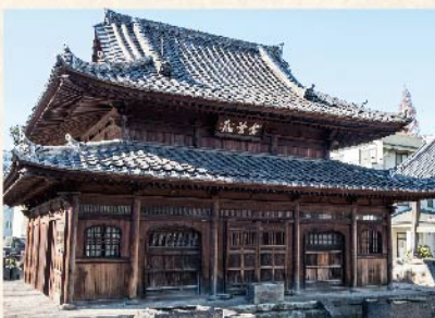
徳川家光が沢庵和尚のために建立した「東海寺」。品川の海を臨む豊かな自然に囲まれた名刹でした。