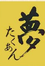
沢庵の遺筆となった「夢」の一字に絡めて

意欲的な催しも行われています。(なお、「夢たくあん」とは、沢庵和尚が書き残した有名な「夢」の一字の書に因んだタイトル。投票結果は、沢庵の故郷、兵庫県豊岡市の「沢庵寺のたくあん漬」がグランプリを受賞しています。)大崎から発信する、日本伝統の食文化提案が、今、「温故知新」の諺どおり、新たな世界観を切り開いていっています。