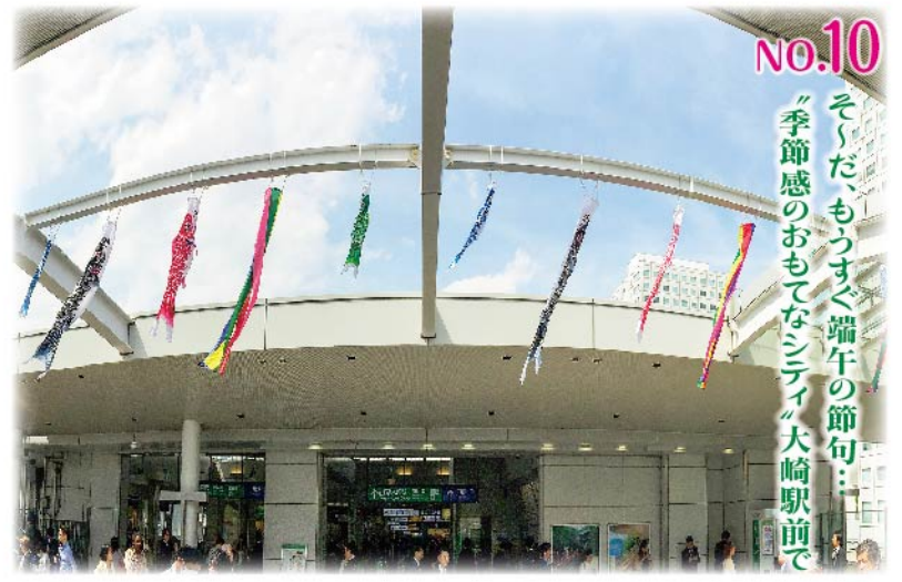
NO.10 そくだ、もうすぐ端午の節句...季節感のおもてなしシティ大崎駅前

もう馴染みの大崎名物クラフトマーケット(グルメも有り)。開催日は、これまで毎月第2水曜から第1水曜へ。大崎駅前では月始めのお楽しみを。