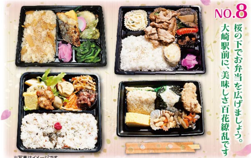
NO.8 桜の下でお弁当を広げましょう。大崎駅前に、美味しさ百花繚乱です

ThinkPark Plazaやゲートシティ大崎、それにアトリウムレジ大崎も加えて、ライブコンサートを開催。春っていいですね。