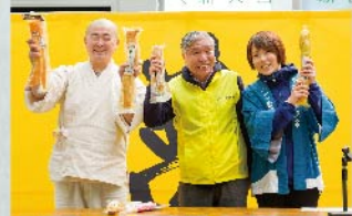
開催成功に沸く主催陣。オープニング会場にて

H31年、本開催。今後の路線も軌道に“ビルの谷間のたくあん祭「お新香の逆襲」”イベントを開催。今後への期待も膨らむ