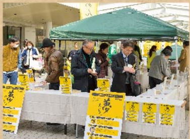
お酒やご飯などに合う様々なたくあんを選んで試食。たくあんの多彩な味わいを吟味し、評価する「夢たくあんグランプリ」