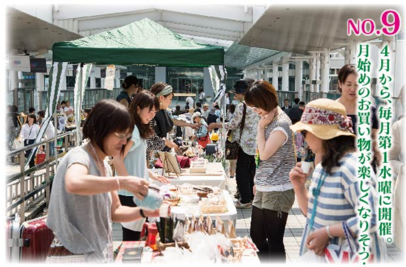
NO.9 4月から、毎月第1水曜に開催。月始めのお買い物を楽しんだりそう...

お昼休みのお弁当パーティーは、緑の公開空地充実の大崎ならではの特権です。ThinkPark Plazaなど、お昼に斉に並ぶお弁当を買って、いざ桜の下へ！