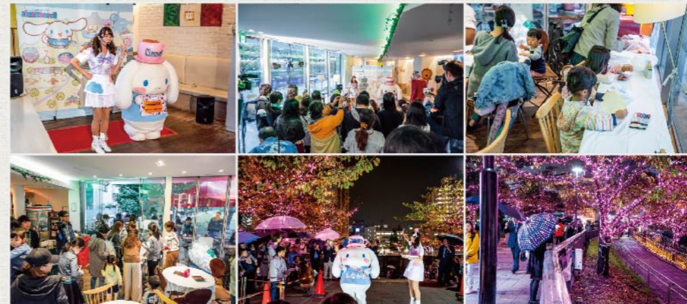
点灯イベント「冬の桜®イルミネーションフェスタ」には大勢の人々が参集。「シナモロールの小箱づくり」も大盛り上がりでした。