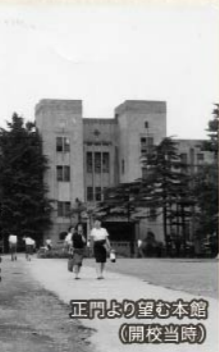
正門より望む本館（開校当時）