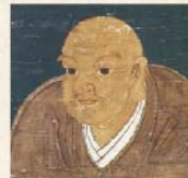
日蓮宗の宗祖、日蓮聖人

今から400年以上も前、日蓮宗の檀林（学問所）が千葉県に創設され、その後1904年（明治37年）に「日蓮宗大学林」として大崎に学舎が設置されて今日に至った立正大学。現在では、その豊かな歴史の上に、「モリスト×エキスパート」を育む。“教育目標として8学部7研究科を擁して活動する「人間・社会・地球に関する総合大学」としての名は、広く国内外に知られるところ。とくに、日蓮聖人由来の建学の精神が生きたる当大学の地域貢献活動は、地域社会の注目を集めると共に、学生達の地域参加がもたらす新たな可能性に大きな期待が寄せられています。