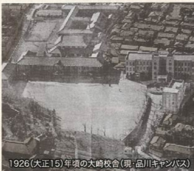
1926（大正15）年頃の大学校舎（現・品川キャンパス）