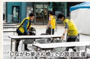
「しながわ夢さん橋」での設置支援