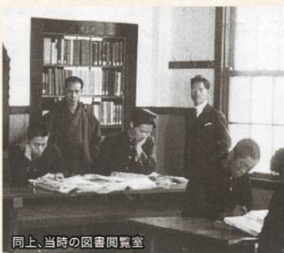
同上、当時の図書閲覧室