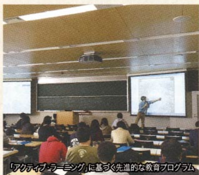
「アクティブラーニング」に基づく先進的な教育プログラム