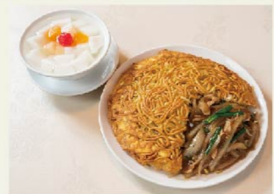
「名物、梅蘭焼きそばで暖まろう」