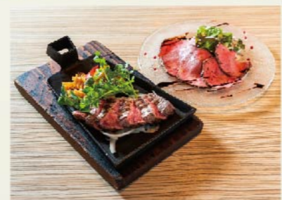
「黒毛牛ステーキetc.で“肉食会”を!」