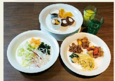
「食べたい&飲みたいをbuffetでどうぞ」

あったかハート&美味しさでウェルカム! 大崎駅前エリアに10数店が揃ったコミ割のお店へ、どうぞ。詳しい「コミ割クーポン」の内容と店の場所等の案内は、「大崎駅前特設テント」配布のクーポン付きチラシをご覧ください。