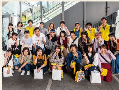
「しながわ夢さん橋2018」にボランティアスタッフとして結集した立正大学生。今年も会場設営から進行支援、「ノンストップ山手線・夢さん橋号」車内での「おもてなし」まで担当。「イベント盛り上げ隊」の柱としての存在感を示しています。

学生や研究者を中心とした地域貢献活動を、「コミュニティ・サービスラーニング授業」の一環と捉えて力を注ぐ立正大学では、「地域連携支援室」や「社会福祉学部ボランティア活動推進センター」を設けて学生と地域のつながりを積極的に推進しています。とくに大崎のまちでは、「しながわ夢さん橋」イベントでの幅広いボランティア活動をはじめ、「お花いっぱい大崎」（花植え運動）での主体的なサポート（写真上）など、地元大崎の魅力づくりに向けた様々なイベント支援を行うほか、五反田商店街においては、柔軟な発想を生かした「まちおこしサワー」の開発プロジェクトなどで、地元の活性化を支援しています。また、品川区との協働による「しながわを学ぶオーブンカレッジ」の開講や、勝島運河護岸に菜の花を咲かす「しながわ花道プロジェクト」への協力など、その地域貢献の姿はまさに「立正安国」の精神そのものと言えるでしょう。由緒ある学舎に育つ若き創造性と熱意——立正大学と学生達の持つそのポテンシャルは今、まちを伸ばす力として開花しつつあります。