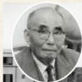
後に総理大臣となった第16代学長 石橋湛山氏 「日本のケインズ」とも称され、自由主義と民主主義を掲げて世界平和に貢献した