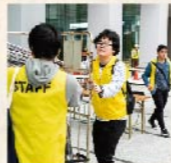
若きボランティア・パワー

学生や研究者を中心とした地域貢献活動を、「コミュニティ・サービスラーニング授業」の一環と捉えて力を注ぐ立正大学では、「地域連携支援室」や「社会福祉学部ボランティア活動推進センター」を設けて学生と地域のつながりを積極的に推進しています。とくに大崎のまちでは、「しながわ夢さん橋」イベントでの幅広いボランティア活動をはじめ、「お花いっぱい大崎」（花植え運動）での主体的なサポート（写真上）など、地元大崎の魅力づくりに向けた様々なイベント支援を行うほか、五反田商店街においては、柔軟な発想を生かした「まちおこしサワー」の開発プロジェクトなどで、地元の活性化を支援しています。また、品川区との協働による「しながわを学ぶオーブンカレッジ」の開講や、勝島運河護岸に菜の花を咲かす「しながわ花道プロジェクト」への協力など、その地域貢献の姿はまさに「立正安国」の精神そのものと言えるでしょう。由緒ある学舎に育つ若き創造性と熱意——立正大学と学生達の持つそのポテンシャルは今、まちを伸ばす力として開花しつつあります。