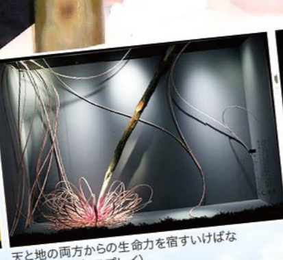
天と地の両方からの生命力を宿すいけばな(ウインドディスプレイ)