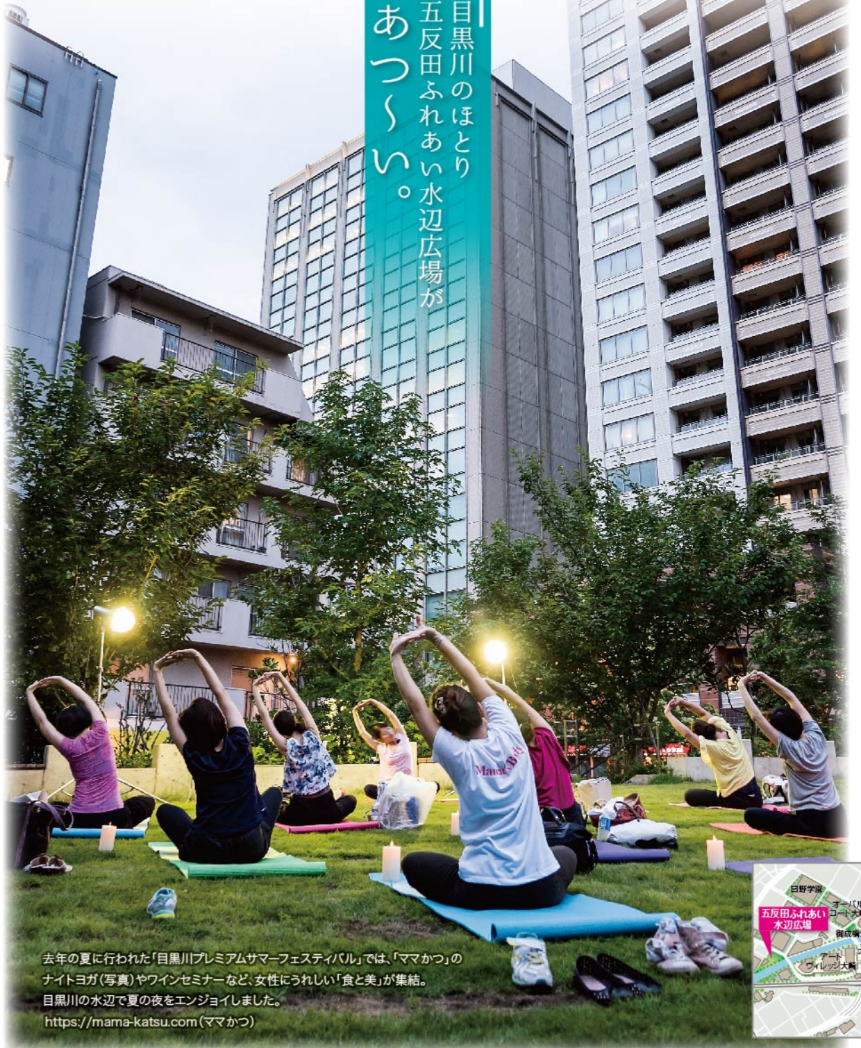
去年の夏に行われた「目黒川プレミアムサマーフェスティバル」では、「ママかつ」のナイトヨガ(写真)やワインセミナーなど、女性にうれしい「食と美」が集結。目黒川の水辺で夏の夜をエンジョイしました。 https://mama-katsu.com (ママかつ)