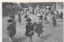
創立当時の園庭で遊ぶ子供たち。当時の園児は約110人ほど