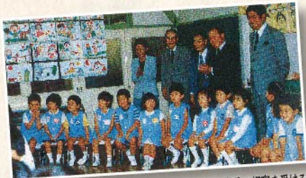
小川文部大臣、鈴木都知事、多賀区長、石原慎太郎諸氏の視察を受ける