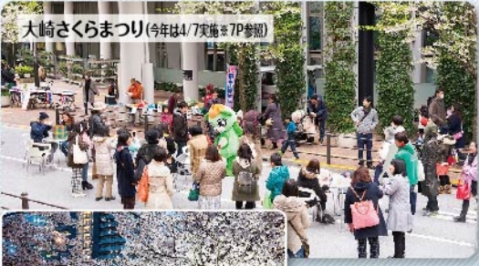
桜の季節を彩る大崎恒例の人気イベント。4月1日実施の目黒川さくらまつりもぜひ! さくらのライトアップ(今年は4/15まで※12P参照)