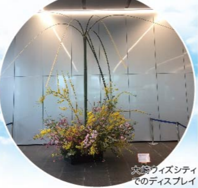
大崎ウィズシティでのディスプレイ