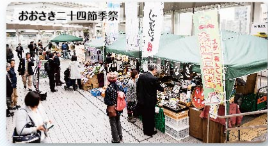
日本の年中行事の中に息づく全国各地の貴重な旬の食材を、大崎駅前(夢さん橋)のキヨスクで出店紹介。生活の潤いや季節を大切にすることを提案するとともに、地方の生産者等を応援しています。