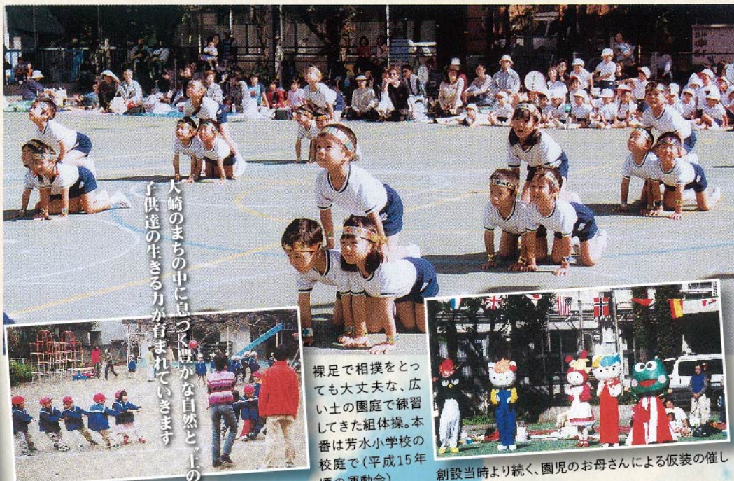
大崎のまちの中に息づく豊かな自然と「上の庭」で子供達の生きる力が育まれていきます