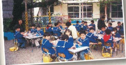
園庭に咲く桜の下でのお花見弁当