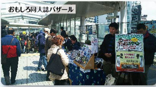
今一番レアな催しとして大注目。あの「お台場コミケ」のフロントイベント、すでにSNS等で話題になった「大崎コミックシェルター」での目玉フェアの一つです。コミケのサブバージョンとして大ブレイク中!