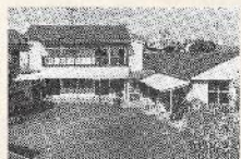
昭和48年頃の園庭から見た園舎。この頃から保育室などの大規模な増設が始まる