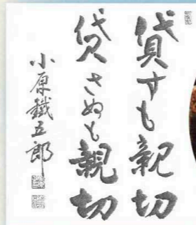
投機的金融を排した小原哲学は、鐵五郎の名をもじって「小原鐵学」とも呼ばれた