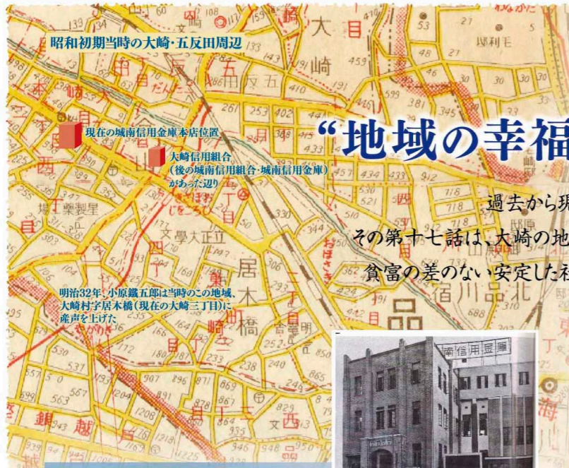
昭和初期当時の大崎・五反田周辺