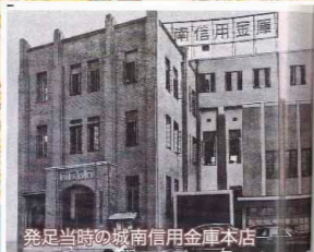
発足当時の城南信用金庫本店