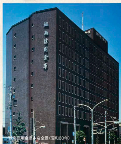
城南信用金庫本店全景(昭和60年)

しての務めに徹したのでした。その後、全国信用金庫協会名誉会長就任と同時に勲一等瑞宝章を授章。金融界のリーダーシップパーソンとしてのその生涯は、ここ大崎の発展を支える地域金融機関の歩みと共にありました。