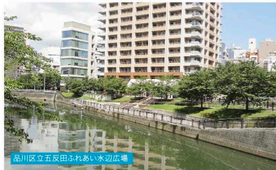
品川区立五反田ふれあい水辺広場

■品川区立五反田ふれあい水辺広場ある「さくらてらす」には、地域の方が憩いの場としてご利用いただくことができ、また大崎・五反田地区の情報発信を目的とした「ギャラリー」がございます。明るい日差しが入るギャラリーです。ぜひお気軽にお立ち寄りください。