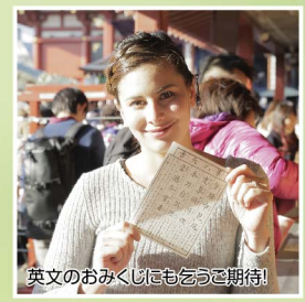
英文のおみくじにもどうぞ期待！