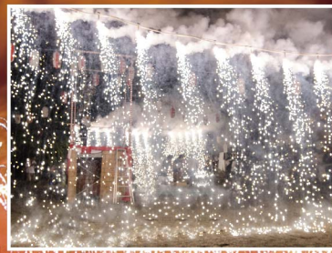
盆踊り大会最終日(7/17)に行われる豪快な花火

川面を伝わる風も涼やかな「五反田ふれあい水辺広場」で夏の宵。模擬店並ぶ緑の広場では、アウトドアグッズやライブサウンドで寛ぐ多くの人が賑わいます。――夏の夜のまつりの祭典、目黒川夜市。ミュージシャンの競演やフラットマーケット、さらに大崎一番太郎など人気キャラの登場と、盛り沢山のお楽しみをお届けするフレッシュなサマーマーケットです。今年の開催は7月29日(金)・30日(土)の2日間。伝統的な日本の夏祭りはまたひと味違った大崎の、新しいクールを提供します。