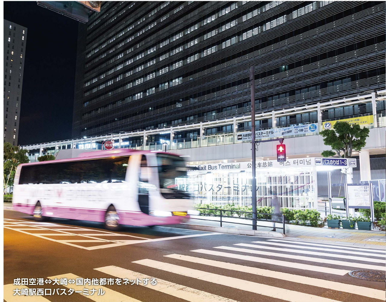
成田空港⇄大崎⇄国内他都市をネットする 大崎駅西口バスターミナル