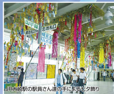
JR大崎駅の駅員さん達の手による七夕飾り