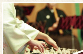
外国人日本文化体験の催しも

家族の成長の尊い思い出をつくる「一心泣き相撲」など、忘れかけていた日本人独自の「人生の通過儀礼」を、居木神社なりの新しい所作を通じて執り行っています。