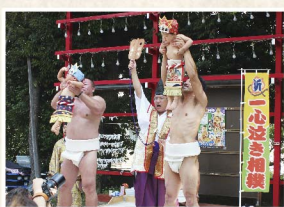
ことしの9月18日(日)に行われる「一心泣き相撲」は、赤ちゃんが運しく泣くことで健やかに育つことを祈願する。今注目の行事(詳しくは居木神社のwebへ)

尊い日本の伝統行事や郷土の催しを今に伝える役目を担う居木神社のその取り組みは、季節の節目を彩る神事を中心にまさに多彩。正月の歳旦祭、元始祭に始まり、春祭りや納涼祭(盆踊り)、さらに荘厳な例大祭から年越しの祓いに至るまで、その数十種以上にも及びます。季節の風物詩とも言えるこの豊かな恒例行事に加え、さらに見逃せないのが、新しいかたちで行われる個人的な人生行事。今、地域や親族とのつながりを深める行事としてその価値が見直されている神前結婚式や、厄除けの祈禱、さらに