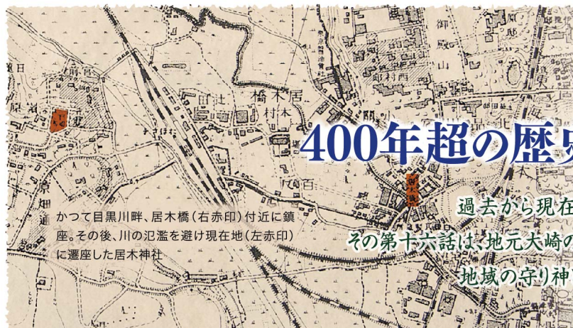
かつて目黒川畔、居木橋(右赤印)付近に鎮座。その後、川の氾濫を避け現在地(左赤印)に遷座した居木神社

過去から現在、未来へと受け継がれていく「ふるさと 大崎」のDNA(原風景)を訪ねる『大崎今昔物語』。 その第十六話は、地元大崎の守護神、居木神社が守り続ける郷土の伝統と儀式。そして、時代の変遷の中でも変わることのない人々の人生行事。 地域の守り神として大崎のすべての氏子の安寧を祈り、その暮らしに寄り添う居木神社の日々がここにありました。