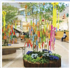
ゲートシティ大崎での七夕飾り。他にもThinkParkや大崎ニューシティでも趣向を凝らした七夕祭りを開催

品川区の参加幼稚園・保育園児が作ったオリジナルの七夕飾りを披露する催しなど、きめ細やかな心遣いがいっぱい。また七夕にちなんだ催事も色々。詳しくは下記の開催施設ホームページをご覧ください。(注・ゲートシティ大崎は7/10(日)まで開催。また大崎駅の短冊応募は7/3(日)まで)