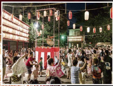
大崎の夏の夜の風物詩、居木神社での盆踊り大会