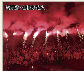
納涼祭・仕掛け花火