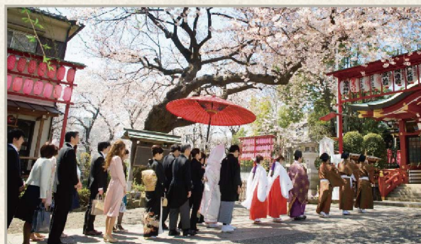
かつて地域の人々が集い、祝う場でもあった神社での結婚式。今またその価値が見直され、若い世代を中心に多くのカップルがここで結ばれています。写真は、雅楽の生演奏をアレンジした居木神社オリジナル「参進」の儀式。