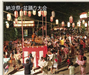
納涼祭・盆踊り大会

遡ること400年以上も前、武蔵国荏原郡居木橋村(現在の山手通り居木橋付近)にて創建されたと伝えられる居木神社。江戸時代初期、目黒川の氾濫を避け、村内の四社を合祀して現在地に遷座、その後さらに三社を合祀して今に至る、郷土の崇敬著しいこの歴史の神社をご紹介します。大崎の社の昔と今を訪ねます。