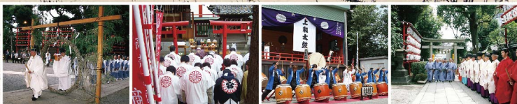
夏越天祓(茅の輪くぐり) 稲荷・厳島神社例大祭(春祭り) 居木神社例大祭での和太鼓演奏 壮麗な例大祭神事