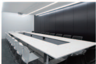
大崎の“創造支援施設”ミーティングスペース BULBの運営もOAMが行っています。

住みたい、働きたい、遊びたい、そして歩いて楽しいまちへ。大崎は今、魅力あるまちへと変身中！—— (一社)大崎エリアマネジメントは、2015年も、そんな大崎のさらなる魅力づくりを目指します。