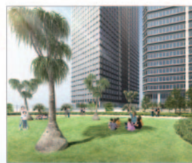
E棟広場 屋上を活用した公開空地。街に開かれた広場として、都市空間のオアシススポットの様な庭に。