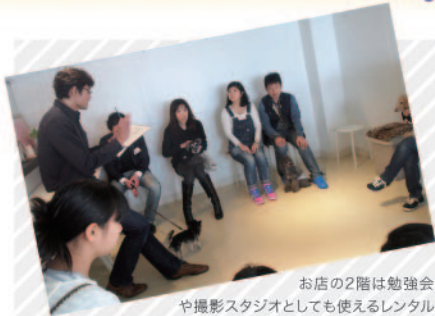
お店の2階は勉強会や撮影スタジオとしても使えるレンタルスペース(1時間¥1800から)。ここでは犬好きのお客さんのために定期的にドッグトレーニング講座も開いています。カフェとワンちゃんがコラボする、ここは不思議な空間です