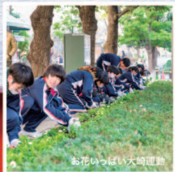
お花いっぱい大崎運動