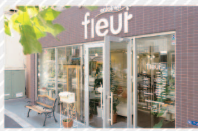
古い建物が多い百反坂で目を魅く明るい店構え