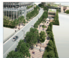
地区幹線道路3号ストリート 街のメインストリートには、多彩な6種類の常緑樹による約250mの二重列植の並木道が。