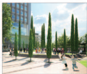
C1棟広場 空に広がるイトスギをシンボルツリーとして植樹し、地域に開かれた街角広場としています。