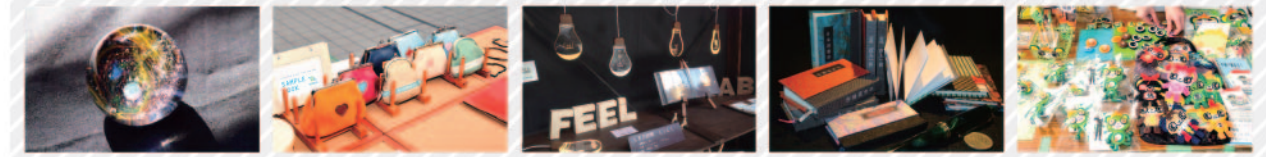
この市では、目の利く大崎のOLの方々をメインターゲットとして1日だけで“勝負”するだけに、感度の高さやファッション性、文化性を行った点で群を抜く作品ばかりを揃えていますから、要注目です。