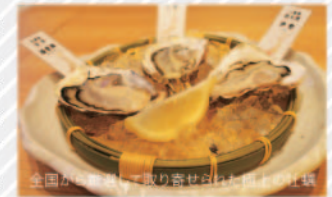
全国から厳選して取り寄せられた新鮮な牡蠣

2014年8月にThinkPark 1階にオープンした「かきの家」。牡蠣は常時新鮮なものを生・焼き・フライや鍋料理などでいただけます。カウンター前には大きな鉄板が。あざやかな手さばきを見ながらお酒を楽しむのもオツなもの。たっぷり飲みたい！というあなたは1リットルサイズの「男のジョッキ」シリーズはいかが？美味しくてリーズナブルな人気店。新年会・歓送迎会のご予約はお早めに！