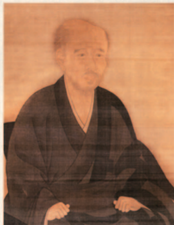
沢庵宗彭頂相 / 東海寺所蔵

戦国時代の1573年、但馬国出石(現兵庫県豊岡市)で出石城主山名家に使える武士の子として生まれた沢庵は、戦乱の世に揉まれ、わずか10歳で出家、食べるものも無い赤貧の中で修行を積み、やがて臨済宗総本山大徳寺の住職にまで上り詰めますが、幕府に背いたとされ出羽上山(現山形県上市市)に流罪、その後家光に邂逅するまで波乱の人生を送った禅僧でした。