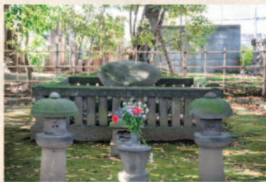
沢庵が眠る東海寺大山墓地。その墓は時の名匠小堀遠州の設計によるものとされ、中央には、まるで沢庵漬けの重石のような自然石が置かれています。