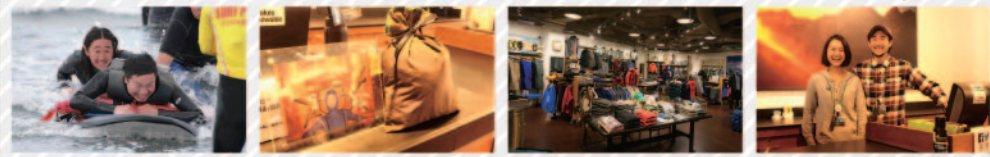
常に地球環境への真摯な提案を行っている ハンディを負う人へのアウトドアサポート リサイクルバッグの無料プレゼントも 広い店内にアウトドアグッズがズラリ スタッフは懇切丁寧なアドバイザー (2015年1月7日まで)

パタゴニア 東京・ゲートシティ大崎 営業時間：11:00~19:00 ※12月は平日20:00まで営業 品川区大崎1-11-1 ゲートシティ大崎 文化施設棟 (土・日・祝日は19:00まで) 03-5487-2101 定休日：年末年始 FBページ： https://www.facebook.com/PatagoniaOhsakiStore