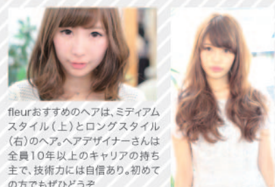
fleurおすすめのヘアは、メディアムスタイル(上)とロングスタイル(右)のヘア。ヘアデザイナーさんは全員10年以上のキャリアの持ち主で、技術力には自信あり。初めての方でもぜひどうぞ