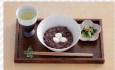
ココアなどの他に、身も心も暖まる優しい甘さのぜんざいも