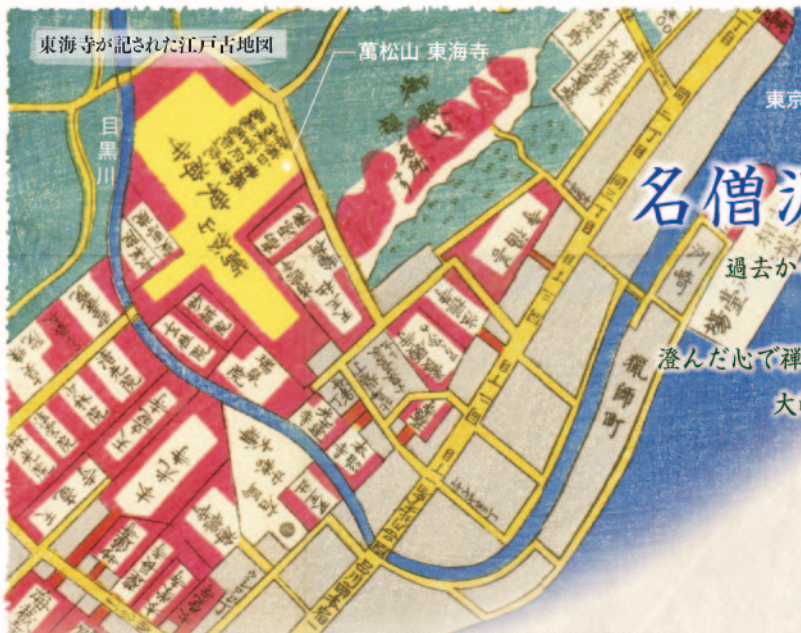
建立当時の東海寺は現在地とは異なり、目黒川の畔に広がる約5万坪もの大禅林でした。

大崎駅から散歩圏内、ごく身近にあった郷土の貴重な歴史ストーリーを再発見しませんか。