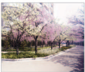
A2棟遊歩道 目黒川の景観資源である桜並木と連続性を持たせた広場空間。大きなシダレザクラが目印。