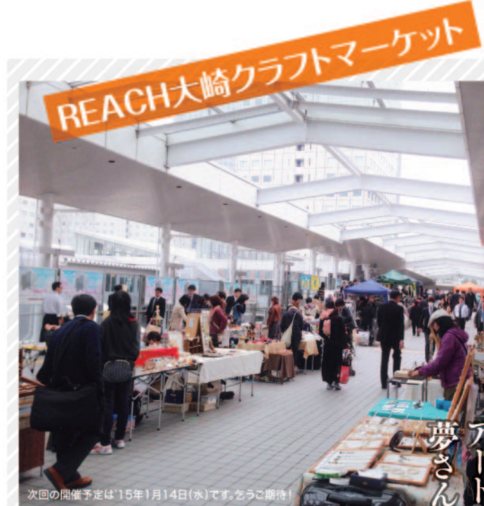
次の開催予定は'15年1月14日(水)です。をうご期待！