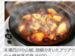
本場四川の山椒、胡椒のきいたアツアツの土鍋麻婆豆腐 ¥600

四川料理のチェーン店として有名な陳麻家。中でも大崎のお店は、ライセンス営業ゆえの個性的な展開が特徴です。ごく気軽に楽しめる¥2,980