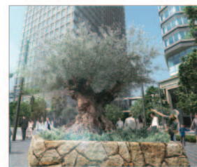
小関橋交差点(オリーブの交差点) 街の中心の交差点には象徴の木オリーブの大樹を植樹し、賑わいの街路空間を創出します。