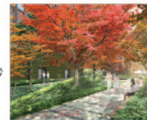
A1棟広場 モミジやサクラ・サルスベリなど、季節によって表情を変える樹々を配した憩いの空間です。

区域内の約250mの幹線道路沿いは2重列植の並木道とし、中心部の交差点には街のシンボルツリーとして樹齢300年以上のオリーブの大木が植えられる予定です。