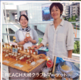
REACH大崎クラフトマーケット