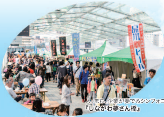
人、まち、企業が奏でるシンフォニー 『しながわ夢さん橋』

人々がともに住み、働き、学び、親しみ、楽しむまちへ(都市再生ビジョン)。いきいきとした大崎のまちづくりへ、(一社)大崎エリアマネジメント(OAM)は、大崎のまちの魅力づくりを応援しています。これまで「しながわ夢さん橋」などの数多くの地域イベントのサポートをはじめEVカーシェアリングの支援活動など、大崎のまちの付加価値づくりに力を注いできました。大崎が目覚ましい発展を遂げ、まちづくりのステップも“まち運営”への新たな段階へ入ったとされる今、OAMはこれまでの活動実績の上にさらに新たな魅力づくりへの歩みを続けていきます。新しい年の2015年もOAMの活動にご期待ください。