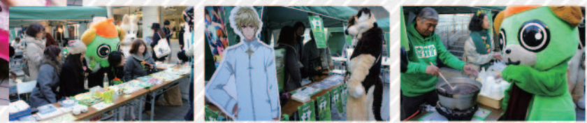
12/28(土)~30(火)開催のイベントでは、音楽ライブやダンスライブ、コスプレイベントもやります！詳しくは上記Webで。