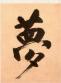
沢庵が息を引き取る際に書いたとされる「夢」の一字

沢庵は、禅や仏教だけでなく、書や和歌、茶道に剣術、兵法、さらに医学と、驚く程幅広い教養の持ち主でもありました。剣術では柳生宗矩(むねのり)との親交があったことで知られ、吉川英治の小説「宮本武蔵」の中では武蔵の師として取り上げられています。また沢庵漬けの逸話