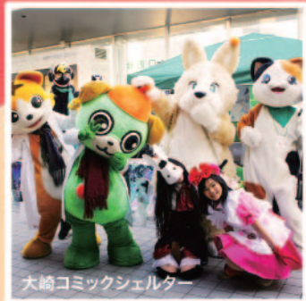
大崎コミックシェルター