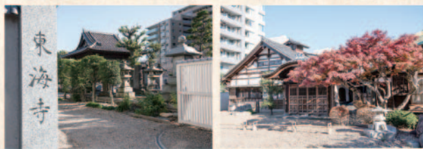
徳川家光が1年間かけて建立した東海寺。写真上の古学院(左)や梵鐘(右)などの歴史的価値の高い建造物が多く、特に東海寺所蔵の文化財は11種にも及んでいます。

沢庵が波乱に富んだ人生の晩年を過ごした東海寺と、名僧眠る大山墓地。將軍家光が沢庵のために建立したその寺で、質実の大切さを諭した話として伝わる『沢庵漬け』のいわれや「唯『夢』の二字を残して逝った話も、お寺や墓と共に大崎の地に残っています。