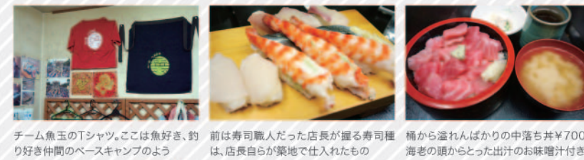
チーム魚玉のTシャツ。ここは魚好き、釣り好き仲間のベースキャンプのよう 前は寿司職人だった店長が握る寿司種は、店長自らが築地で仕入れたもの 桶から溢れんばかりの中落ち丼¥700。海老の頭からとった出汁のお味噌汁付き