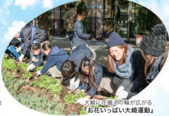
大崎に花植えの輪が広がる 『お花いっぱい大崎運動』