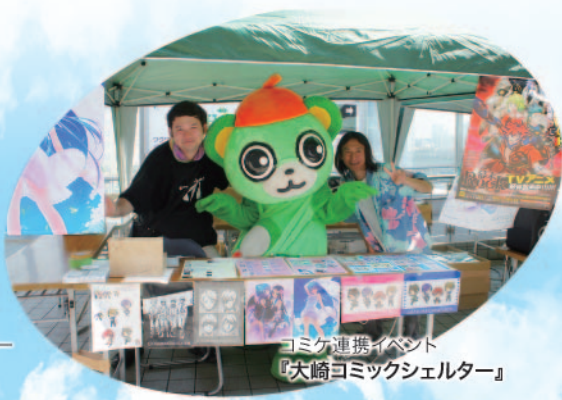
コミケ連携イベント 『大崎コミックシェルター』