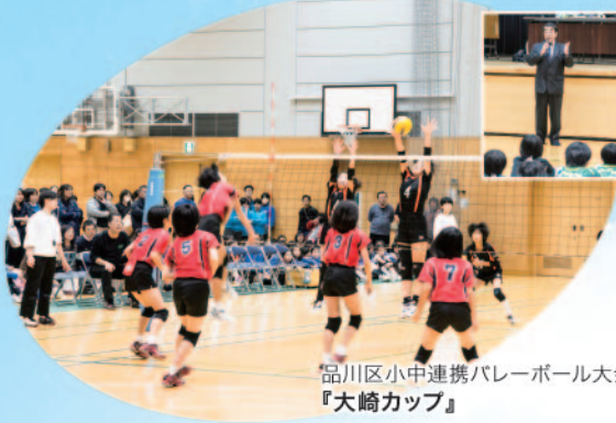
品川区小中連携バレーボール大会 『大崎カップ』