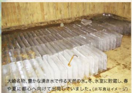
大崎名物、豊かな湧き水で作る天然の水。冬、水室に貯蔵し、春や夏に都心へ向けて出荷していました。(※写真はイメージ)