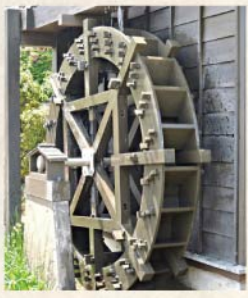
品川用水の清流を受けて回る水車が田畑のここかしこに。(※写真はイメージ)