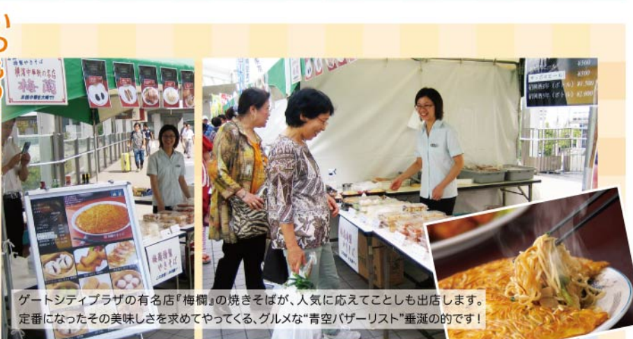
ゲートシティプラザの有名店『梅欄』の焼きそばが、人気に応じてことしも出店します。定番になったその美味しさを求めてやってくる、グルメな“青空バザール”垂涎的のです!