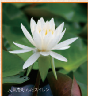
人気を呼んだスイレン