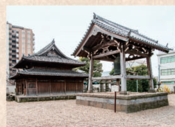
居木橋カボチャ生みの親ともされる沢庵和尚の『東海寺』

かつて目黒川の畔にあった居木神社を中心に、桐ヶ谷から居木橋一帯に広がる農地で採れたことから居木橋カボチャと呼ばれたこの名産品は、有名な東海寺住職の沢庵和尚が当地の名主(松原庄左衛門)に栽培させたのが始まりと言われています。