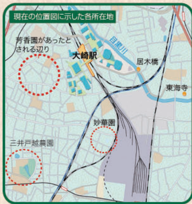
かつては緑の農作地や温室が広がっていた大崎周辺。現存する東海寺を除き、芳香園や妙華園、さらに三井戸越農園もいまはその面影も無く、史実が伝えるのみとなっています。

ゆくゆくは今の頃のシーズン、もっとも人気のある鉢花はシクラメン。このシクラメンも居木橋カボチャ同様、日本ではじめて栽培された場所が大崎でした。明治30年頃、荏原郡大崎村にあった「芳香園」です。すでに温室栽培が行われていたとされています。その後の大正時代には戸越にあった「三井戸越農園」でも本格的に栽培され、やがて昭和になってからは花の人気の高まりとともに日本全国へシクラメン栽培の波が広がっていきます。この「芳香園」ではまた、洋花のシネリアも、小誌春号で紹介した植物園「妙華園」と共に日本で最初に栽培されたと伝えられています。明治後半から大正の頃の大崎エリアでは、このように植物栽培に適した環境から至るところで、人々のニーズにいち早く応えるかのように花や野菜の栽培が盛んに行われていたのです。近代的なビルが並ぶ大崎の「ふるさと」の記憶。それはカボチャ畑や温室が広がっていた過ぎし時代の景観でもあります。