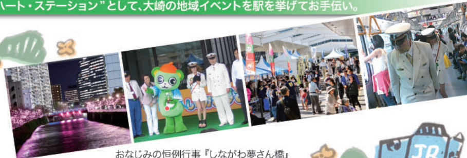
おなじみの恒例行事『しながわ夢さん橋』

をはじめとする大崎のまちイベントへ、大崎駅では、これまで拠点機能や最寄り駅としての役割を通じ、駅を挙げてお手伝いをしてまいりました。新しい年も、ホットなところで地元の人々を訪れる方々を応援する“元気づくり駅”としてお役に立ちたいと願っています。