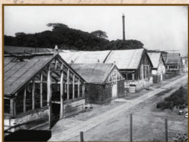
『芳香園』や『妙華園』に続き、シクラメンやシネリアの栽培が行われた三井戸越農園(写真は『三井戸越農園』と呼ばれていた頃の大正時代の三井戸越農園※第一園芸株式会社所蔵写真より)