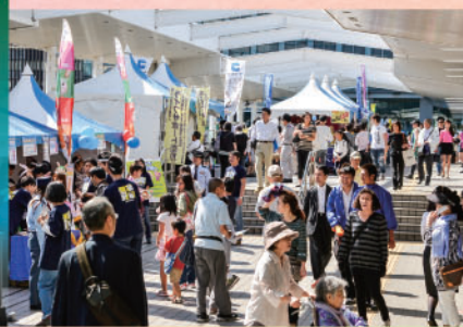
人とまちと地域の企業が一つになり、秋の3日間を多彩な 催しで盛り上げます。ご存知、大崎のビッグイベント“夢さん橋”。