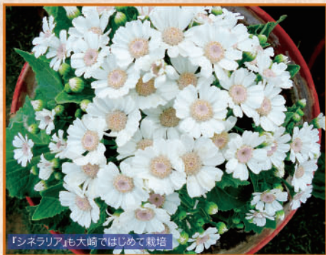
『シネリア』も大崎ではじめて栽培

シクラメンと同様に、明治30年代に大崎で初めて本格栽培されたとされる早春の鉢花シネリア。『芳香園』や『妙華園』に始まり、その後は『三井戸越農園』でも栽培されるようになります。植物園の『妙華園』では、このシネリアの他にも、スイレンやバラ、ランなど、当時珍しかった西洋植物が多く植えられ人々の人気を集めていました。いずれの花々も生育は難しく、特にシクラメンやシネリアなど、日本ではじめて根づかせたその栽培技術の高さは注目に値するもので、当時としては最先端を行う「大崎ファーム」だったと言えます。