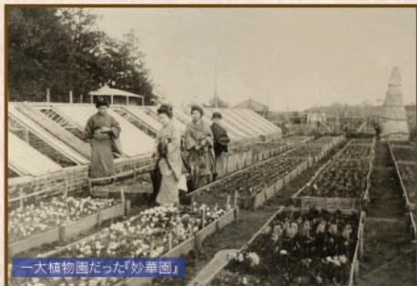
一大植物園だった『妙華園』