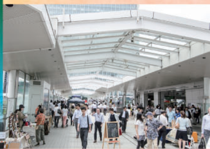
個性多様なクリエイター達が自慢の手作りの品を持ち寄り 『夢さん橋』に出店。人気を集める平日一日だけの手作り市です。