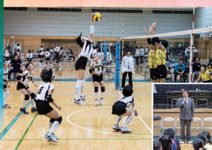
人気スポーツイベントとして定着。バレーを通じ、地域と つながりながら子供たちの可能性を伸ばすことが目標です。

★以上の催事は『大崎周辺まちづくり協議会』及び『目黒川みんなのイルミネーション実行委員会』の主催によるものです。