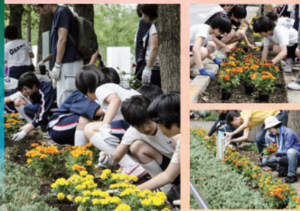
大崎駅東口、西口の両エリアに根づいた“花植えの輪” 毎年2回、みんなで我が街の花を植え、咲かせています。

いつも何かが生まれ始まっている“イベントシティ大崎”へ、ようこそ。“エリアマネージメント”がサポートします。人々がともに住み、働き、学び、親しみ、楽しむまちへ(都市再生ビジョン)。大崎のいきいきとしたまちづくりへ、(社)大崎エリアマネージメント(OAM)は2013年の今年も、大崎のまち催事を力いっぱい応援してきました。人と人、人とまちのつながりを目指した様々なイベント支援を通じて“大崎の元気づくり”が少しでも実現できたとしたら幸いです。新しい年2014年も、ぜひ私達のエリアマネージメント活動にご期待ください。