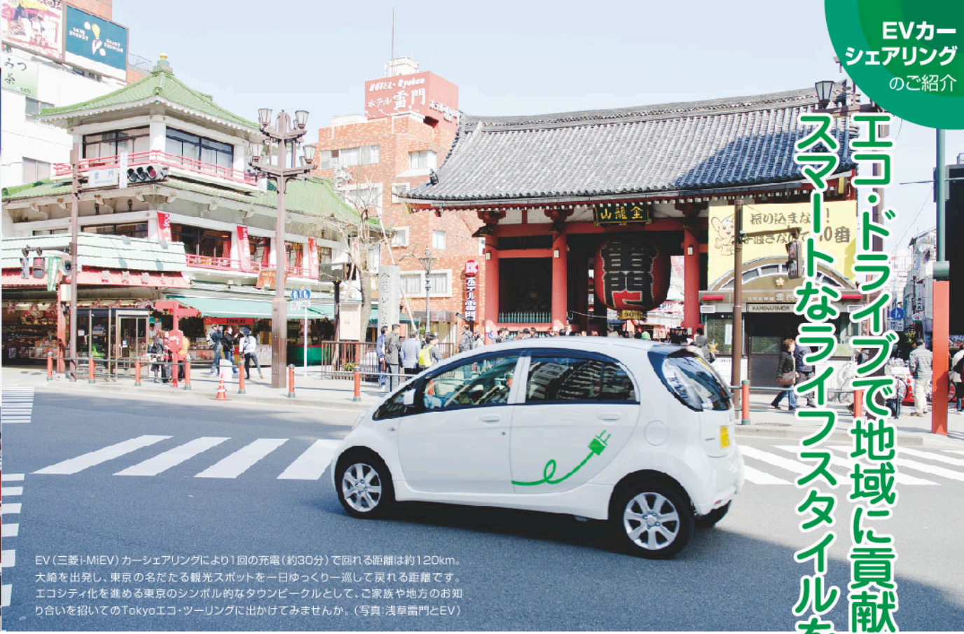
EV(三菱i-MiEV)カーシェアリングにより1回の充電(約30分)で回れる距離は約120km。大崎を出発し、東京の名だたる観光スポットを一日ゆっくり一巡して戻れる距離です。エコシティ化を進める東京のシンボリックなタウンピエールとして、ご家族や地方のお知り合いを招いてのTokyoエコ・ツーリングに出かけてみませんか。(写真:浅草雷門とEV)