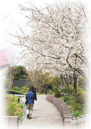
「ThinkPark Forest」の緑に映える桜は、絶妙な美しさ