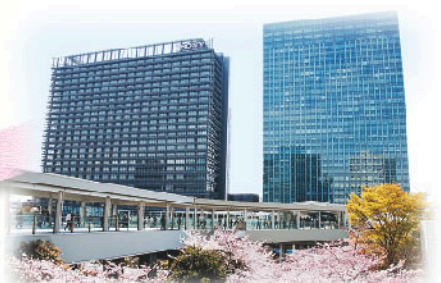
ここが大崎だと誇れるような個性豊かな駅前景観へ、さらに花を添えます