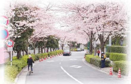
道を覆い尽くすかの様な桜の並木は“再開が創った自然”の成果

大崎駅西口の4つの地区が一緒になって開催する今年初めてのお花見大会! 2年目の春を迎えた大崎ウエストシティタワーズ横の並木の桜に“花を添える”かのように楽しく、元気に盛り上がります!ぜひ遊びに来てください。