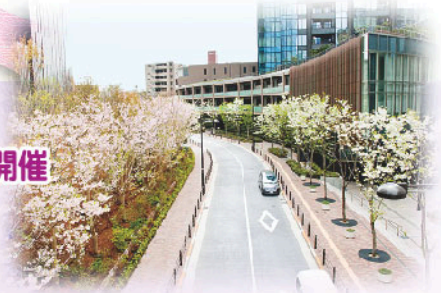
ソニーと大崎ウエストシティタワーズ間の美しい桜並木は、2年目の春を迎えました。

美味しい、楽しい! 屋台が勢揃い! 焼きそば、焼き鳥、ビールetc.の屋台が出ます。春のひと時を楽しみましょう!