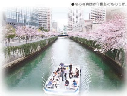
もはや観光スポットとなった目黒川に行く、お花見クルーズの船

大崎の春の風物詩、目黒川の桜が水面に映えて、ことしも青空の下でお弁当を広げるには格好のシーズンとなりました。—いま、大崎の環境資源として、また歩いて楽しいまち並みづくりの成果となる桜並木や緑の空間が、人々に大きな潤いをもたらしています。鮮やかな春の色を散らす桜の名所は、目黒川沿いを始め大崎のいたるところに勢揃い。とっておきの場所で、とっておきのお弁当を食べながら大崎の春を満喫してください。