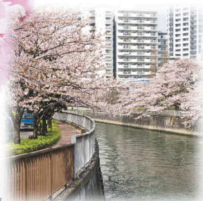
●桜の写真は旧年のものです

外は春爛漫— “歩いて楽しい都市空間づくり”を進める ここ大崎では、 お弁当を楽しみながらの お花見ブレイクがおすすすめです！