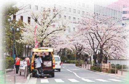
山手通りから目黒川に向かって入るとすぐに、桜並木がお出迎え