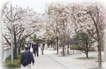
広々とした広場状空地に潤いを添える桜は、新しい大崎の象徴的空間