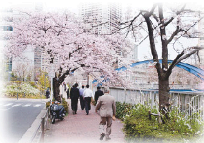
“冬の桜のイルミ”でも有名になったけれど、春の本物の桜は、さすが