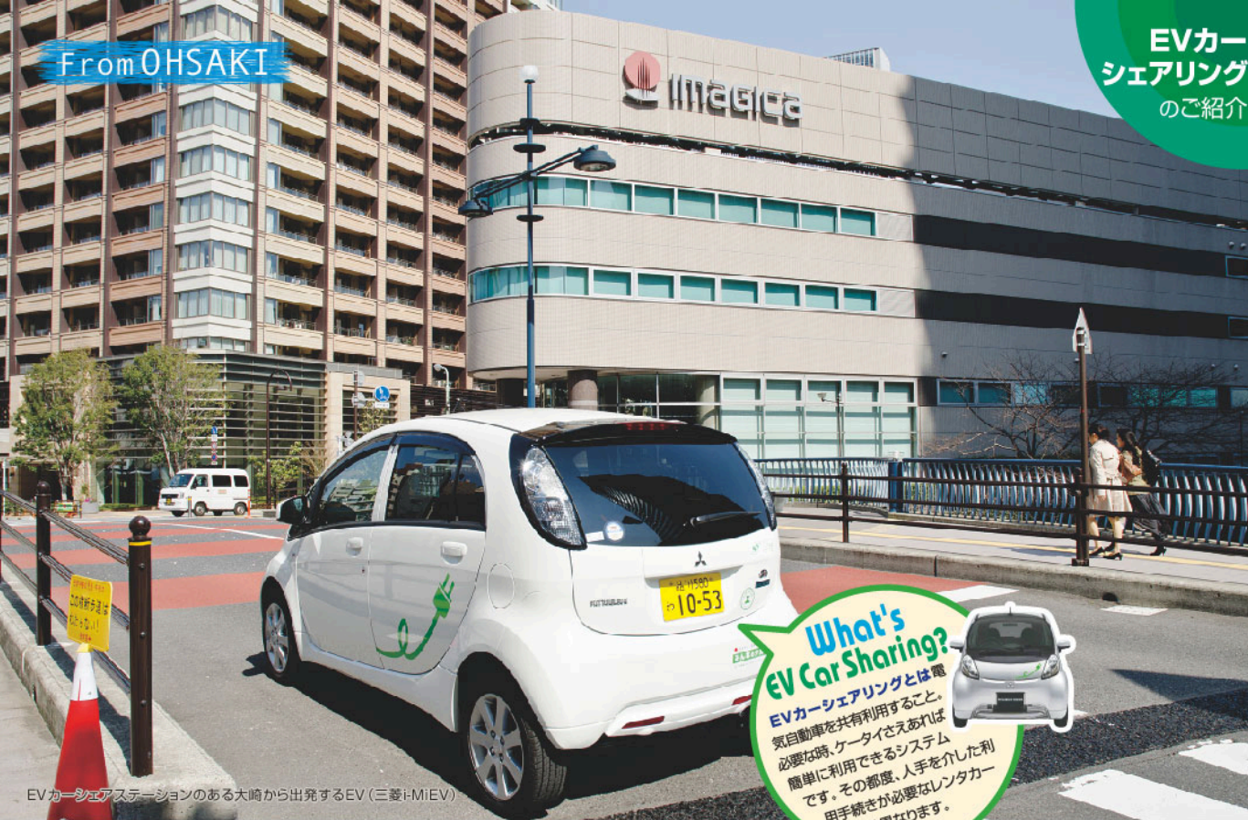
EVカーシェアステーションのある大崎から出発するEV(三菱i-MiEV)

What's EV Car Sharing? EVカーシェアリングとは電 気自動車を共有利用すること。 必要な時、ケータイさえあれば 簡単に利用できるシステム です。その都度、人手を介したカー 用手続きが必要なレンタカー とは異なります。