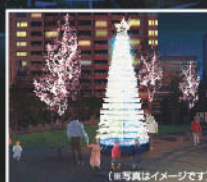
大崎みんなの夢ツリー

大崎の新しいイルミネーションイベント「目黒川みんなのイルミネーション2010」。舞台は大崎駅と五反田駅の間を流れる目黒川沿道の桜並木。「冬の桜の開花」をテーマに、沿道の桜並木68本を約15万6000球のイルミネーションで彩る冬のお花見イベントです。地元企業協賛のもと、再開発で変わりゆく大崎を“新しいふるさと”にと願って始めたこのイベント、12月17日からは、大崎で育つ地元小・中学生の夢が書かれた「大崎みんなの夢ツリー」(※14頁参照)も点灯し、イルミネーションとともに冬の夜を暖かく照らしています。