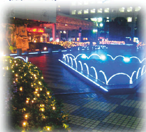
【大崎ニューシティ】

憩いの広場0パティオを優しく包む輝き。噴水池も花壇も、冬のミニ・ワンダーランド。駅前再開発の先駆者、大崎ニューシティ伝統のイルミネーションは、こどもも地域一体化の象徴。0パティオを照らします。