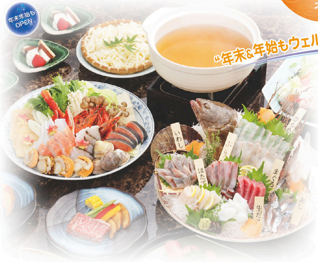
新鮮な網元直送の魚介類と産直有機野菜で知られた大衆割烹のお店 日本海庄や 。厳選素材をふんだんに使った郷土・漁師料理や健康バランス重視の女性向けメニューで、冬の夜を“ホッカホカ”に満喫しませんか。(ゲートシティプラザ 2F)