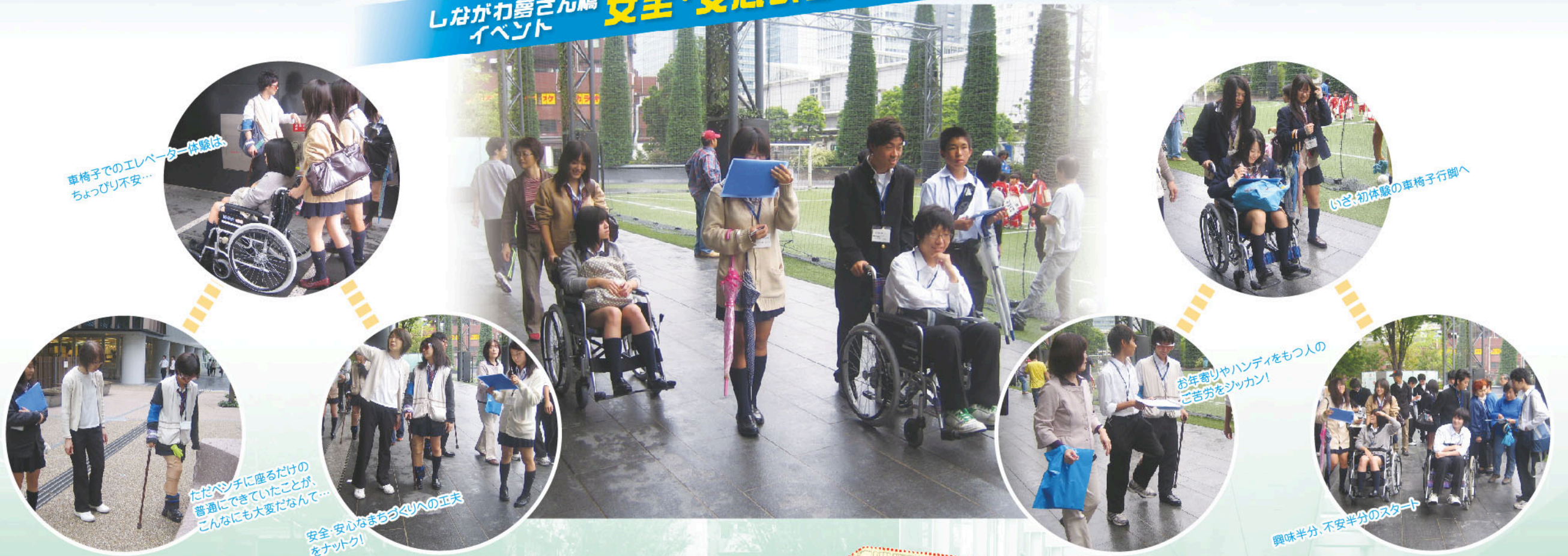
車椅子でのエレベーター体験は、 ちょっと不安...