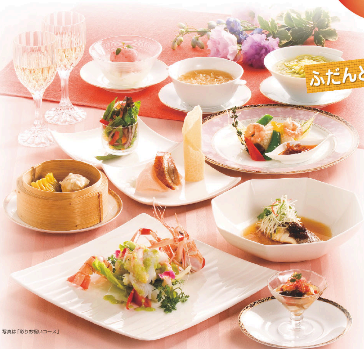
写真は「彩りお祝いコース」

大崎駅前エリアに揃った美味多彩な名店達。 会社やお仲間どうしのスペシャルな忘年会&打ち上げや新年の宴に、 個性的なメニューや雰囲気、サービスが特徴のお店を探してみました。