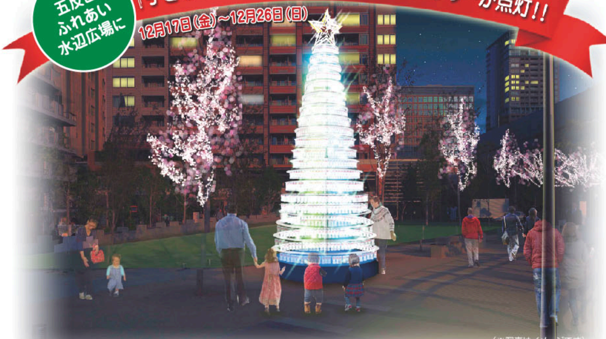
(※写真はイメージです)

『子どもたちの夢』で出来たクリスマスツリーが点灯!! 12月17日(金)~12月26日(日)