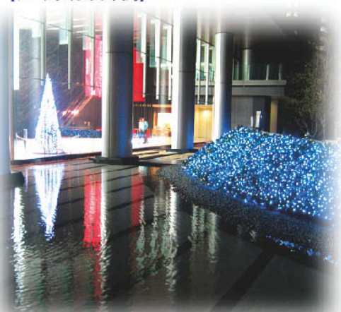
【アートヴィレッジ大崎】

“アートなまち”にふさわしい光の造形。クリスマスな煌きは、ビルをさらに彩る先進のオブジェ。ビルの外にも煌めくツリーが映える透明感。埋込みのイルミも光のオブジェと共鳴して、このまちの先進性を伝えます。