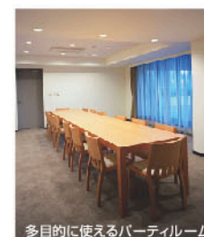
多目的に使えるパーティールーム