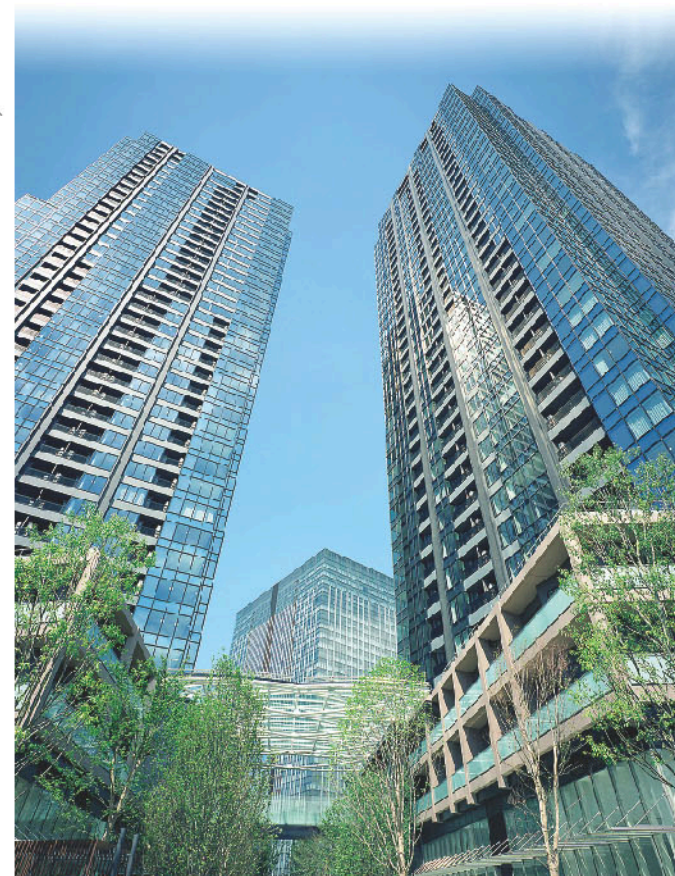
駅直近のフレッシュ・タワー