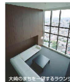
大崎のまちを一望するラウンジ

“提示しています”。高品質なエンタランスや眺望のラウンジ、さらに交流を育むパーティールームなどの豊かな共用部に加えて、住まう人のライフスタイルをきめ細かく計算し尽した専有部。これらすべてが副都心大崎の恵まれたロケーションを得て、いま新しい「大崎の住まいと暮らしのありかた」を提示しています。