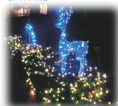
【ゲートシティ大崎】

館内のツリーにも負けないトナカイと星々の可憐な煌きが随所に。山手通り沿いのアプローチ部やノースガーデンにも、この季節の主役たちが輝きます。館内には豪華なツリーも登場。