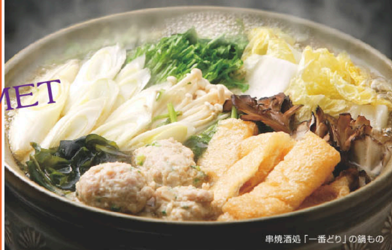
串焼酒処「一番どり」の鍋もの

Xマスや忘年会、仕事納めや年越しの団欒、新年会、さらに成人式の宴まで、大崎にお勤めの方や地元のご家族が迎える年末年始の行事に向けて、大崎のあたたかグルメシーンへご案内。